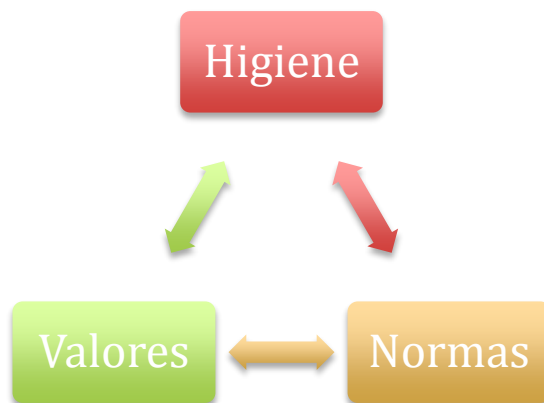
Figura 2: Aspectos fundamentales para la intervención.

A continuación se representa de forma esquematizada los aspectos fundamentales que se abordarán cómo línea base en esta intervención.