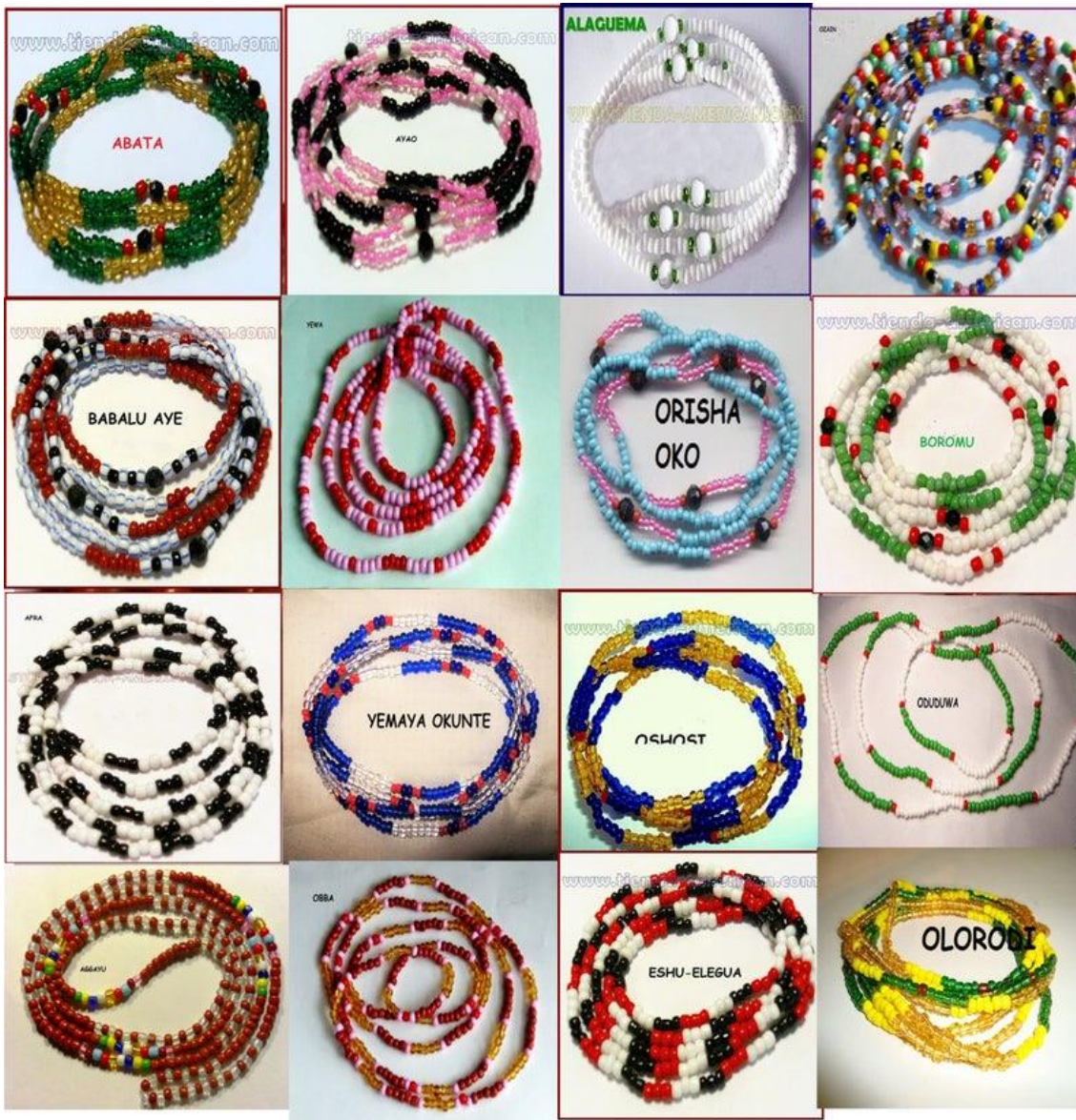
Imágenes de los collares con los colores representativos de cada deidad 38