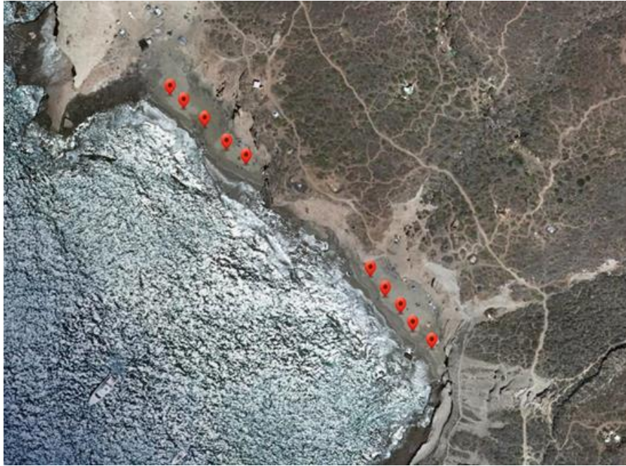
Imagen 3: Imagen satélite de los puntos de muestreo de la playa Diego Hernández.