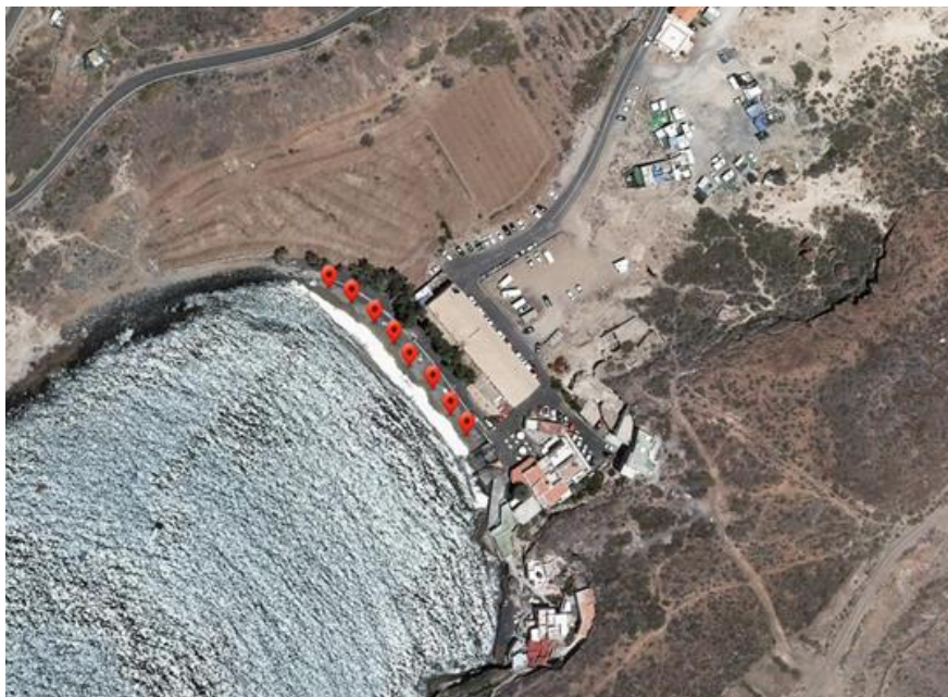
Imagen 2: Imagen satélite de los puntos de muestreo en el Puertito de Adeje, separados aprox. por 10 m.

La recogida de las muestras se llevó a cabo una vez cada dos semanas a marea baja, a lo largo de la línea de pleamar. Se tomaron cinco muestras por playa, con una distancia de 10 metros entre los puntos. El área de muestreo de cada punto se delimitó con el marco de madera para asegurar la homogeneidad de las muestras. Con el vaso de acero se recogió la arena superficial de la zona delimitada para tamizarla. Los residuos recogidos en el tamiz de 1 mm se almacenaron en recipientes estériles.