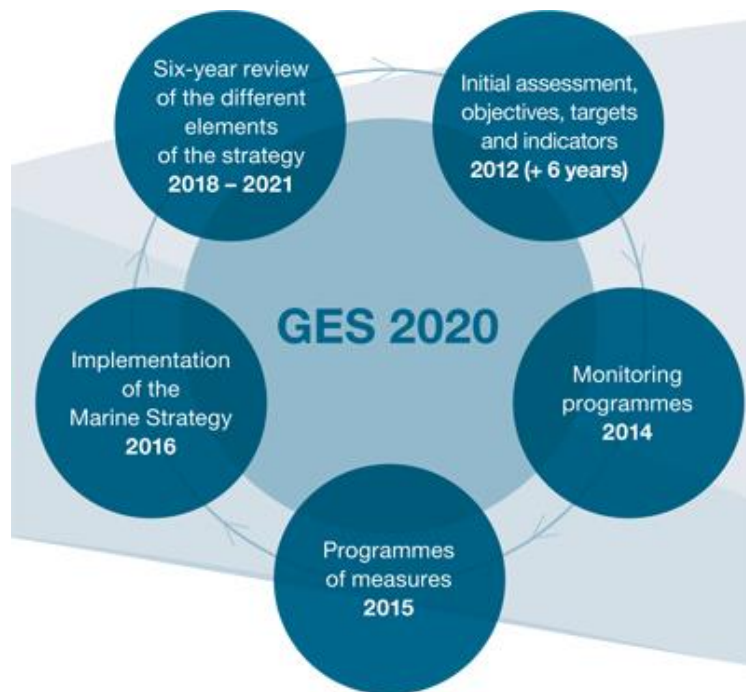
Imagen 1: Para alcanzar el GES para 2020, se requiere que cada Estado miembro desarrolle una estrategia para sus aguas marinas. Además, las Estrategias Marinas deben mantenerse actualizadas y revisadas cada 6 años 21 .

de los que dependen las actividades económicas y sociales relacionadas con el mar. Para alcanzar ese propósito, cada estado miembro debió desarrollar una estrategia para sus aguas marinas. En España, la MSFD fue transpuesta por la ley 41/2010 20 en la que las costas españolas se dividieron en 5 regiones, siendo una de ellas las Islas Canarias. Desde entonces, el Gobierno español ha iniciado varias acciones para controlar la presencia de basura marina, incluidos los microplásticos, en las playas 17 .