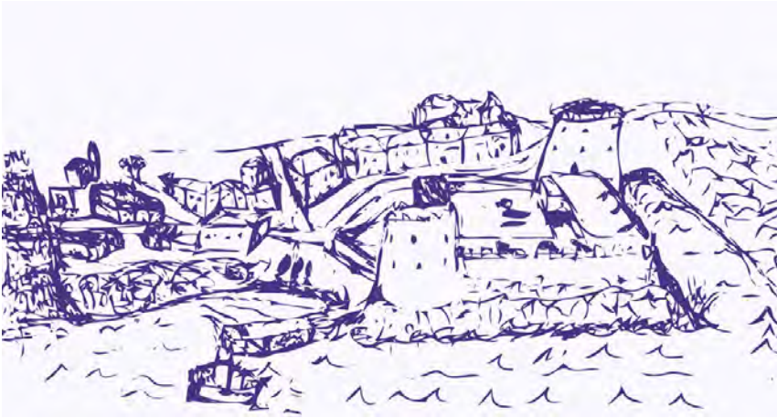
Figura 1: Boceto del lugar de Santa Cruz en torno a 1560. La interpretación parte del trazado urbano plasmado en el plano de Leonardo Torriani (TORRIANI, p. 74) con las pertinentes modificaciones edilicias.