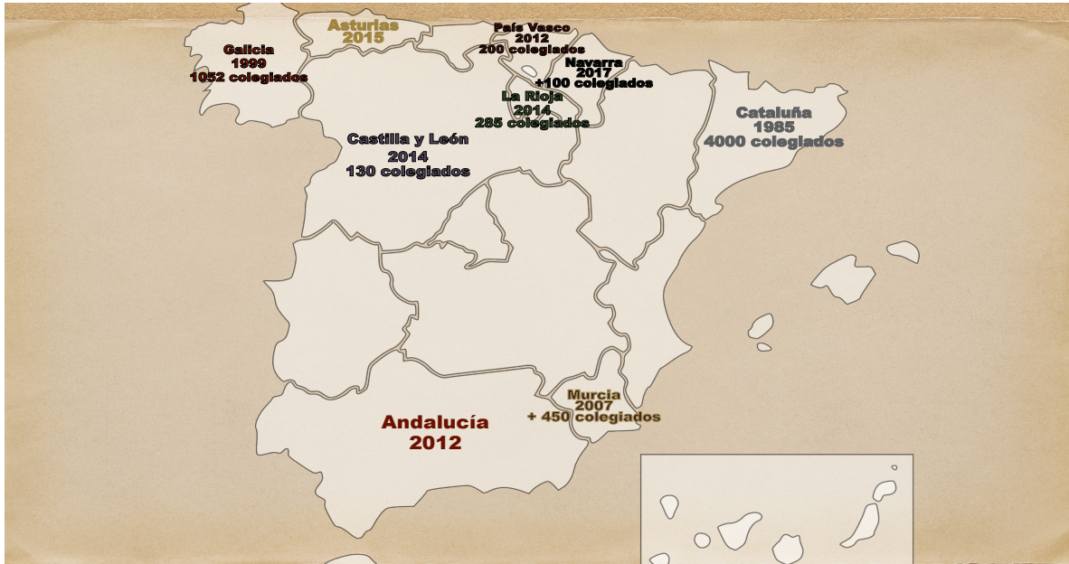
Mapa de los colegios con su año de comienzo y número de colegiados. Elaboración propia.