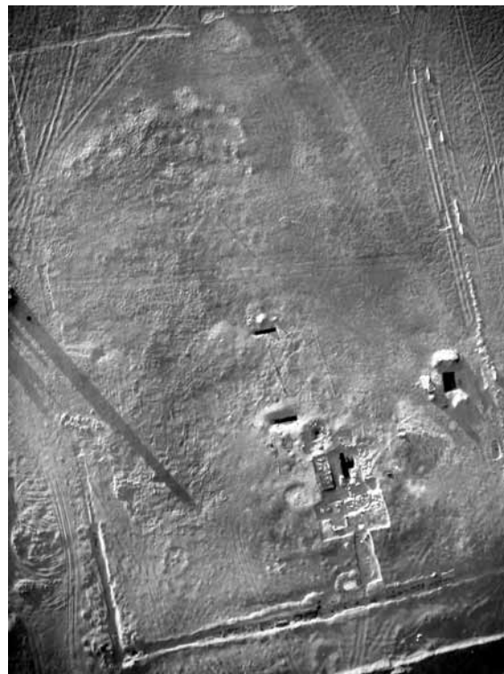
Figura 1. Foto aérea del área del Osireion

El recinto fue ampliamente reestructurado durante los reinados de Alejandro II Aegos, hijo de Alejandro Magno, Ptolomeo I Soter y Ptolomeo II Filadelfo; así lo atestiguan los diversos bloques hallados por los saqueadores hacia los años cincuenta del siglo pasado, decorados con relieves y textos jeroglíficos con el nombre de su lugar de procedencia: Pr-hf . Dichos bloques