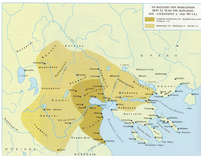
Χάρτης 1. Τα μακεδονικά βασίλεια περί τα μέσα του Ε' αι. π.Χ., βλ. Σακελλαρίου 1992: 70, εικ. 38.

Θουκυδίδη (2.99.2) οι Ελιμιώτες και οι Λυγκηστές «και άλλα έθνη επάνωθεν» αναφέρονται ως Μακεδόνες, η επικράτεια των οποίων προσαρτήθηκε σταδιακά στο βασίλειο των Τημενιδών τον Δ' αι. π.Χ. Η Αιανή είναι μία από τις σημαντικότερες αρχαιολογικές 1 θέσεις της αρχαίας Μακεδονίας με πρώιμο επιγραφικό υλικό από την Εποχή του σιδήρου και εφεξής 2 .