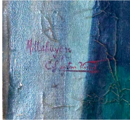
Figura 8. Detalle de firma en pintura donde se puede leer Millaküyen / Celia Leyton.