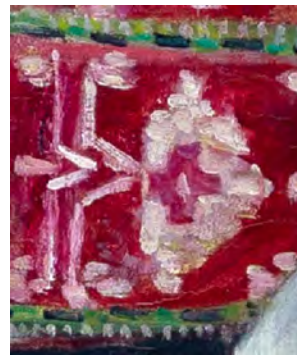
Figura 11. Detalle de tariwe de autorretrato de Celia Leyton.