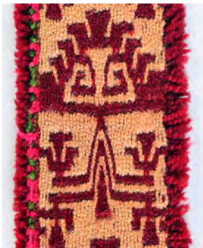
Figura 9. Ícono antropomorfo tariwe .