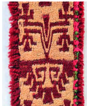
Figura 10. Ícono fitomorfo tariwe .