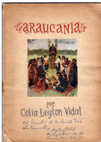
Figura 5. Araucanía . 1953.