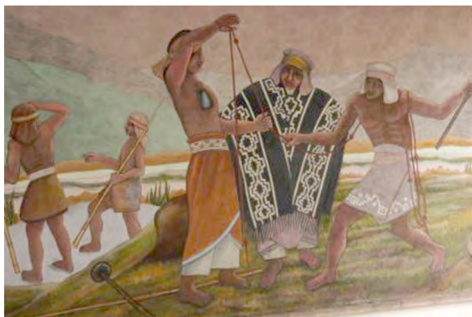
Figura 2. Celia Leyton. Chasqui . 1962. Fresco sobre muro de concreto, 2,80 × 5,75 m. Correos de Chile en Temuco.