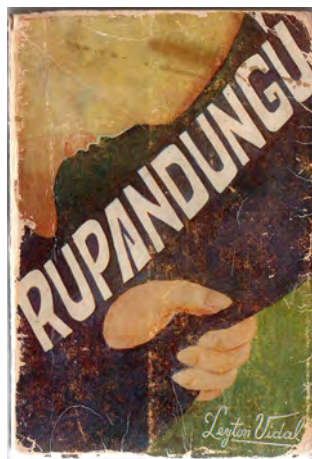
Figura 6. Rupandungú . Editorial Universitaria. 1968.