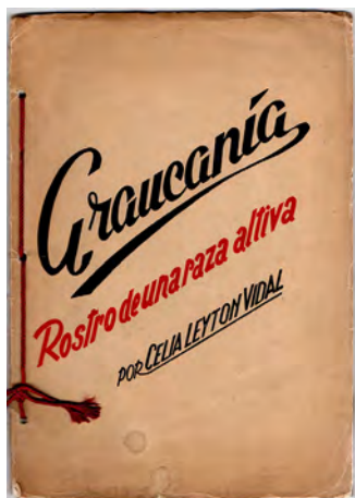
Figura 3. Araucanía, rostro de una raza altiva . Editorial Zig-Zag. 1945.