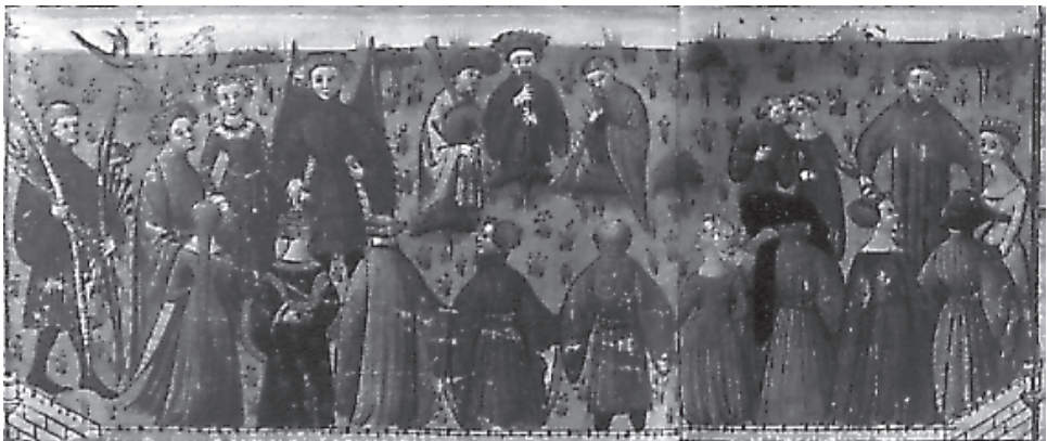
La danza (Roman de la Rose de Guillaume de Lorris)