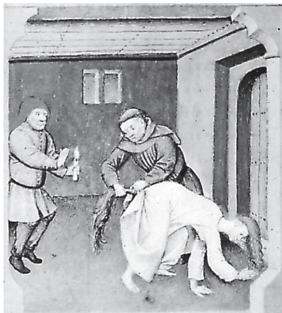
Escena del Decamerón (IX, 10)