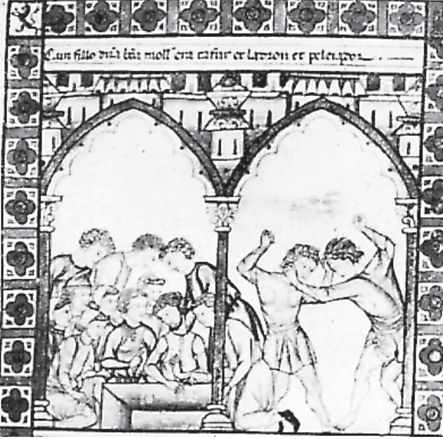
Escena de lidia (Cantiga CXLIV)