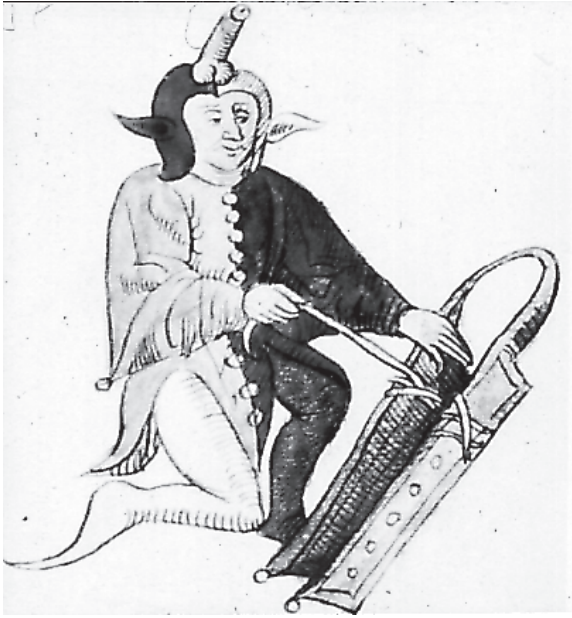
El loco ataviado con la capucha de la virilidad