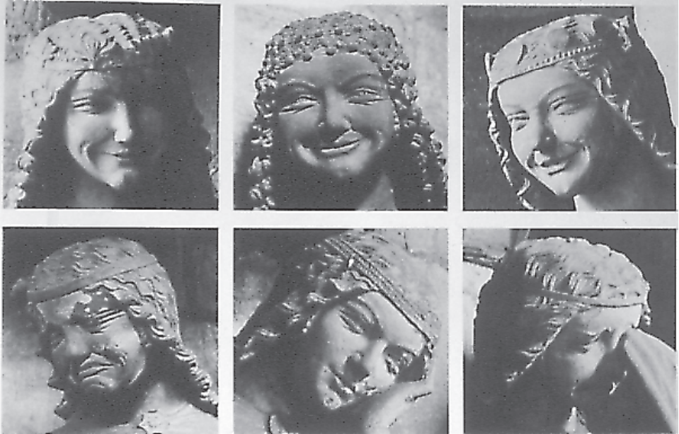
Vírgenes Necias y Vírgenes Prudentes (Catedral de Magdeburgo)