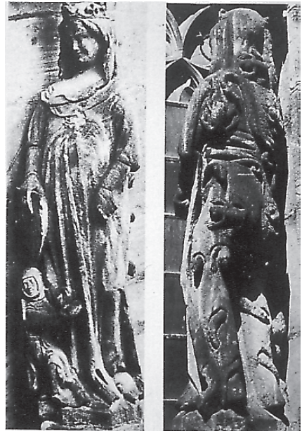
Señora Mundo (Catedral de Worms)