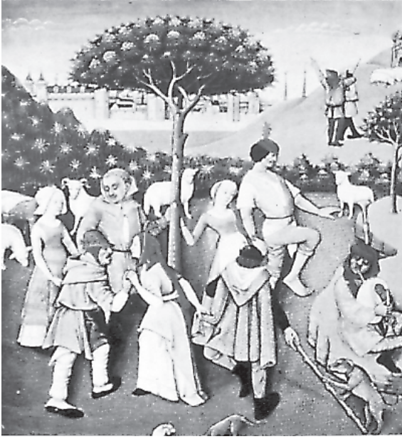
Libro de Horas de Charles d'Orleans