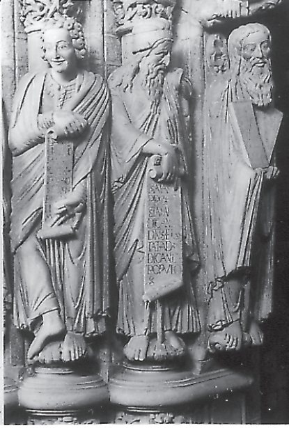
Profeta Daniel (Pórtico de la Gloria, Santiago)