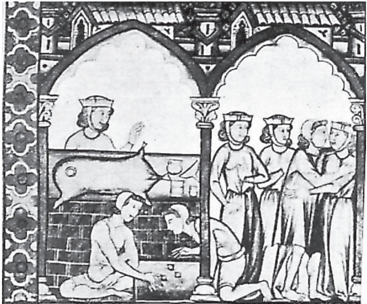
Escena de Juego (Cantiga XCIII)