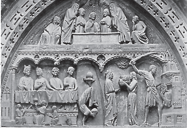
Bodas de la hija de Godoforus (Notre-Dame de Semur-en-Auxois)