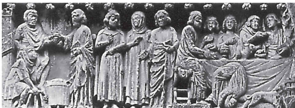
Festín de Herodes (Catedral de Ruán)