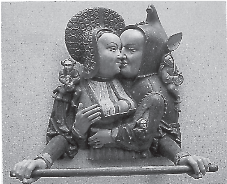
El loco y la mujer mundana (Servilletero de Clèves)