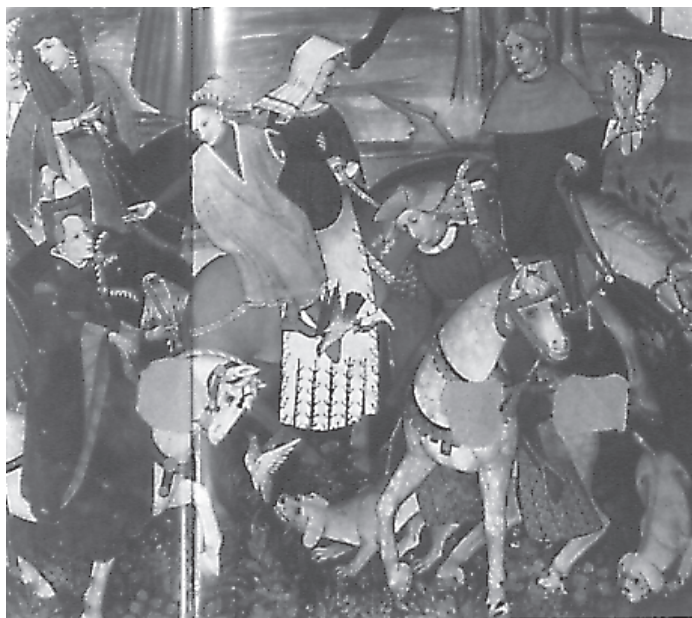
Frescos del Castillo della Manta