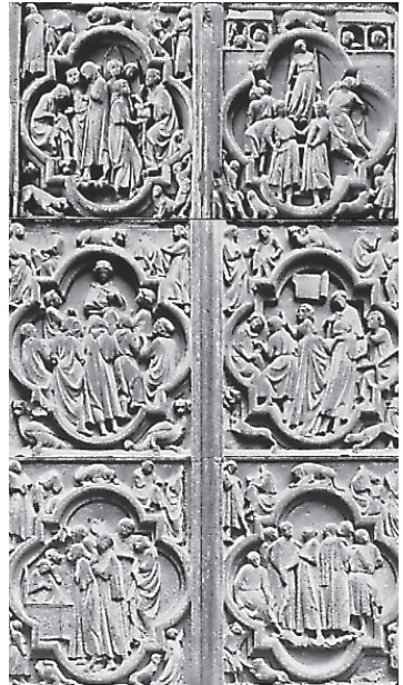
Escenas de la vida estudiantil (Catedral de París)