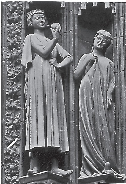
Virgen Necia y Príncipe Mundo (Catedral de Estrasburgo)