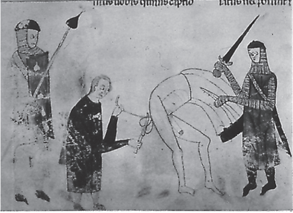
Mutilación del adúltero (B.N. de París, ms. 9187, 32v.)