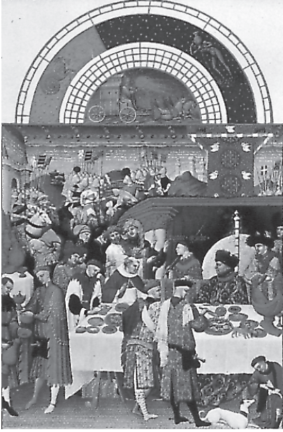
Escena de convivio (Très Riches Heures de J. Berry)