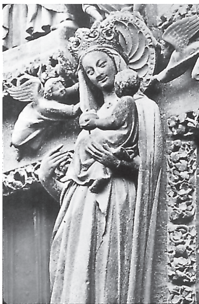
Virgen Dorada (Catedral de Amiens)