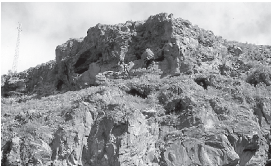
Foto 3. Vista de las Cuevas de Chaurera, en la ladera media del margen derecha del barranco, por encima de las torres de Unelco, actualmente sólo accesibles por escalada.