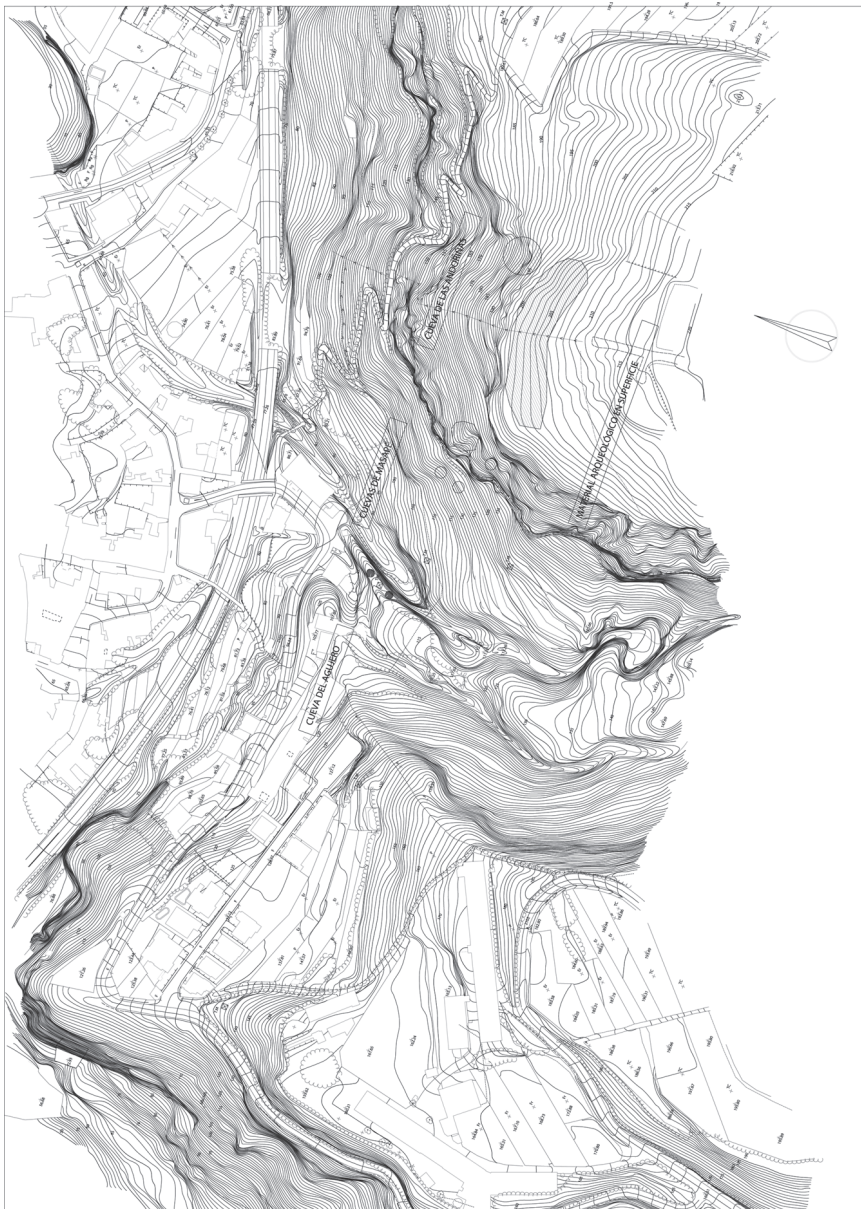
Mapa 1. Emplazamiento de las cuevas de Masapé 1-4 en el Risco de Masapé. A la izquierda, el cauce del Barranco de Chaurera.