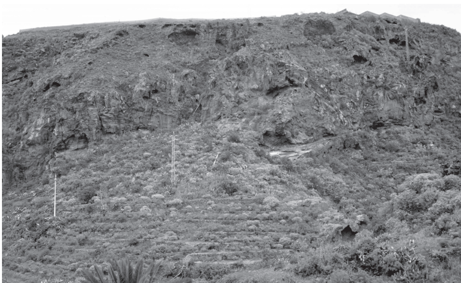
Foto 4. Vista de un espigón de toba entre los cauces de Chaurera y Poncio, donde se sitúa un conjunto de cazoletas con canalillos, cuyo acceso se ha derrumbado recientemente.