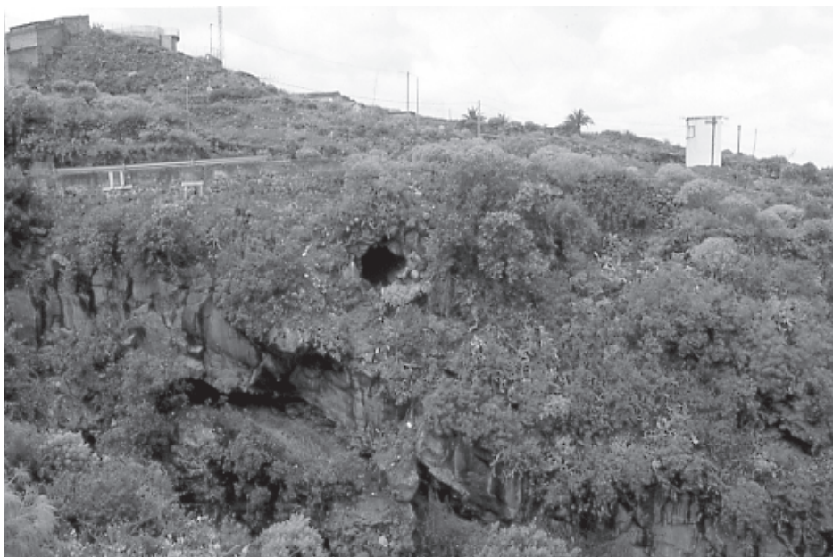
Foto 6. Vista de la Cueva de la Gotera, tubo volcánico con enterramientos excavado por L. Diego Cuscoy en 1947.