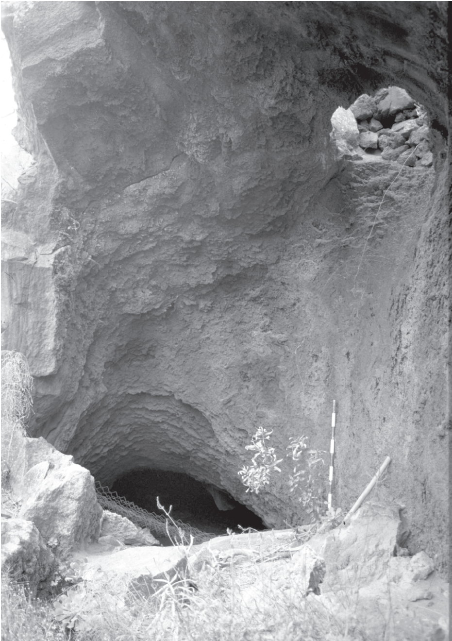
Foto 5. Vista del tubo volcánico denominado Cueva del Agujero, actualmente parcialmente destruido en su tramo inferior por la instalación de una torre de Unelco, cuyo antiguo acceso, un agujero en lo alto del tubo, puede apreciarse en la foto.