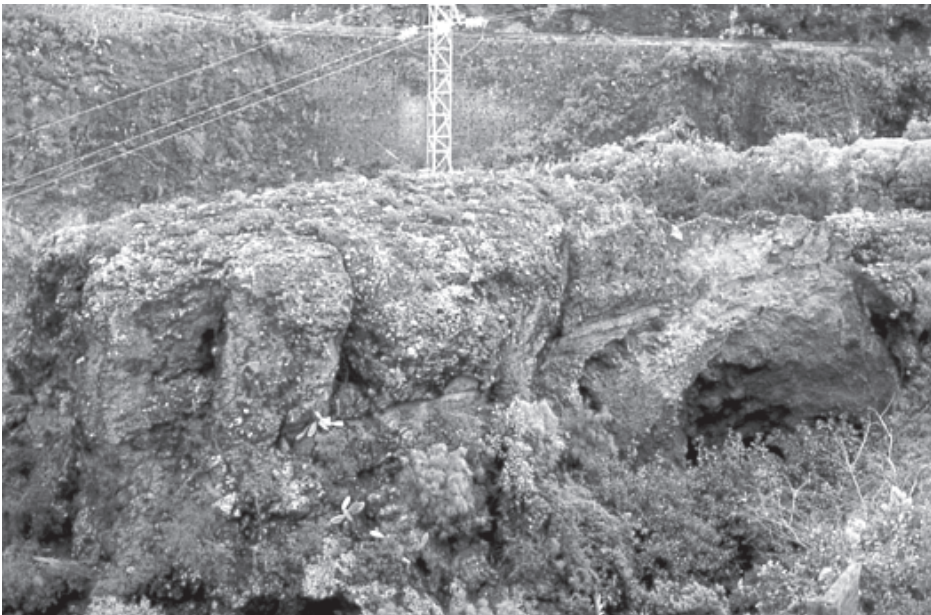
Foto 2. Vista del Risco de Masapé, donde se aprecia la Cueva de enterramiento del Masapé 1, con la boca más amplia, y hacia la izquierda las Cuevas de Masapé 2 y 3, sólo accesibles por escalada.