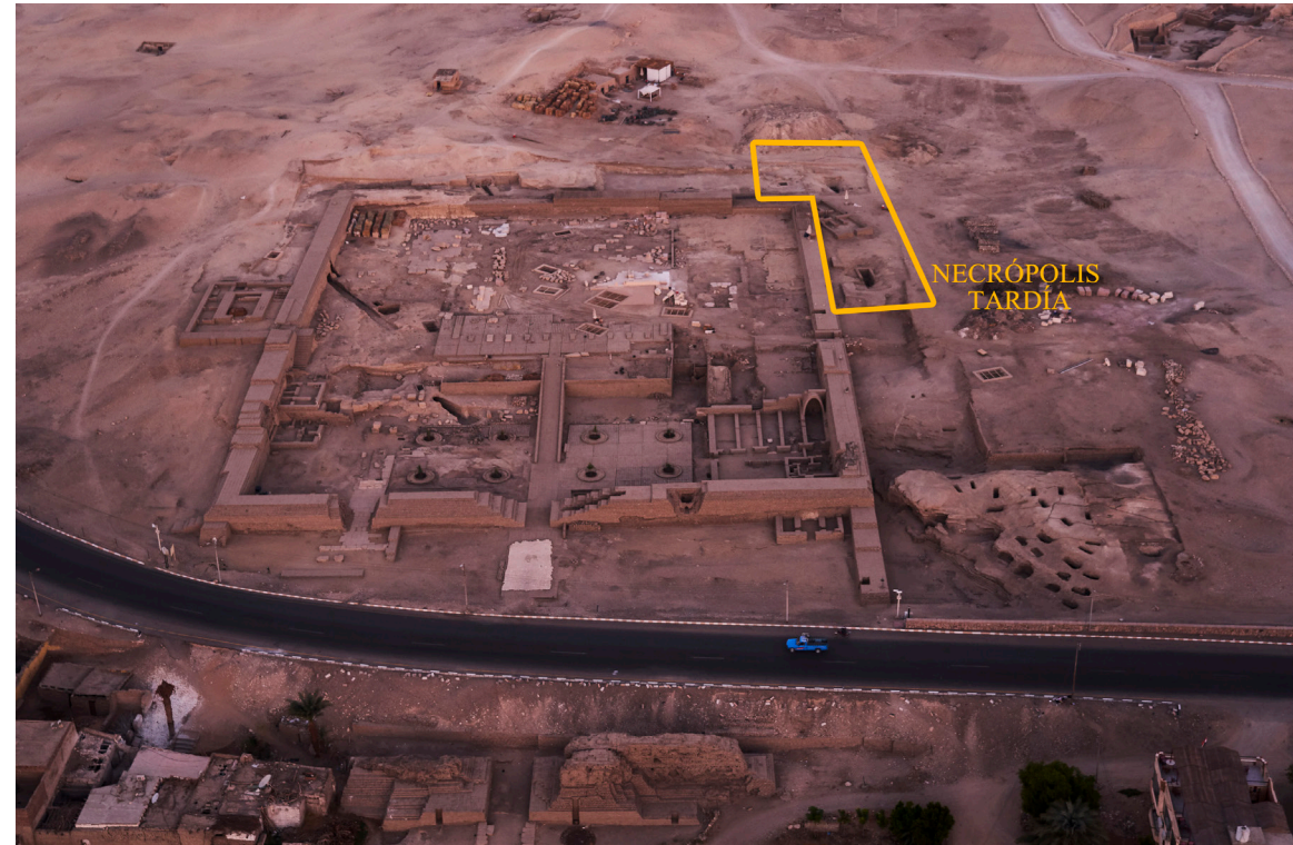
Figura 1. Vista panorámica de la zona.

que hay sobre necrópolis tardías en la zona de El Assasif 2 .