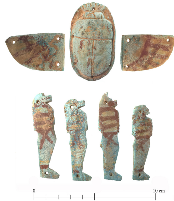
Figura 4. Escarabeo alado con vestigios de pintura amarilla y roja (arriba; No. Inv. 15757) y conjunto de hijos de Horus (abajo; No. Inv. 15758 A-D).