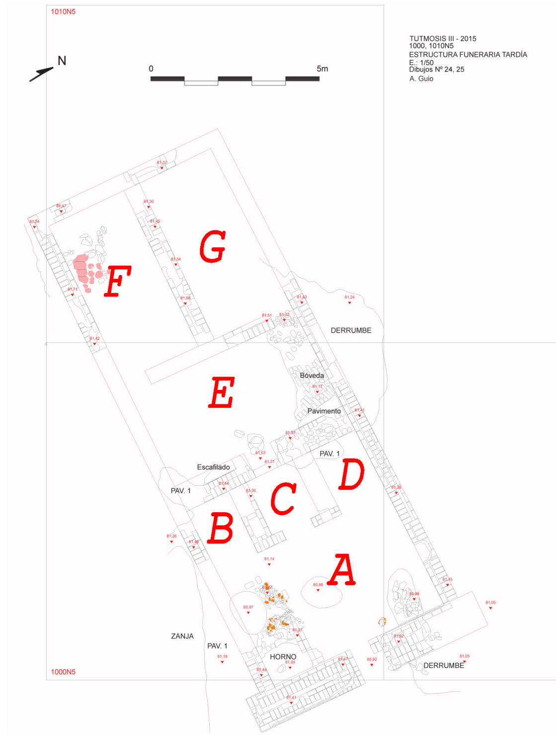
Figura 2. Plano de la estructura superior de la tumba 22. Dibujo: Reyes Somé y Javier Tre.