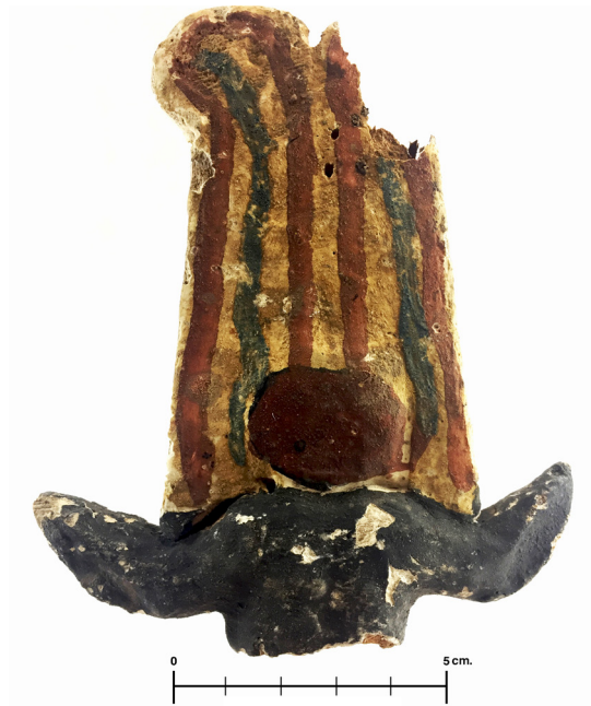
Figura 6. Corona de madera con restos de policromía perteneciente a una estatuilla de Ptah-Sokar-Osiris (No. Inv. 15780).

En conclusión, esta tumba 22 presenta una estructura superior que puede ser datada, en origen, durante la segunda fase de la necrópolis tardía de El Assasif, que corresponde esencialmente a la dinastía XXVI. Aun cuando hay que investigar en profundidad los elementos arquitectónicos y los abundantes hallazgos, se pueden establecer algunas pautas históricas: hay evidencias de un primer