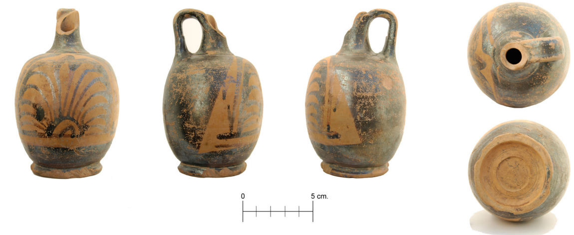
Figura 7. Vaso de figuras rojas (No. Inv. 15856). Fotografía: Inés G. 2018.

La criba que se efectuó en el desescombro de esta tumba aportó también un elemento de interés, pero de época muy posterior. Se trata de una punta triangular de hierro, sin evidencias de óxido, perteneciente a un antiguo proyectil foráneo 20 (No. Inv. 15841). Una segunda pieza de este tipo,