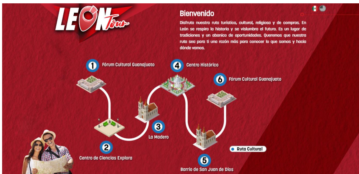
Ruta realizada por León Tour