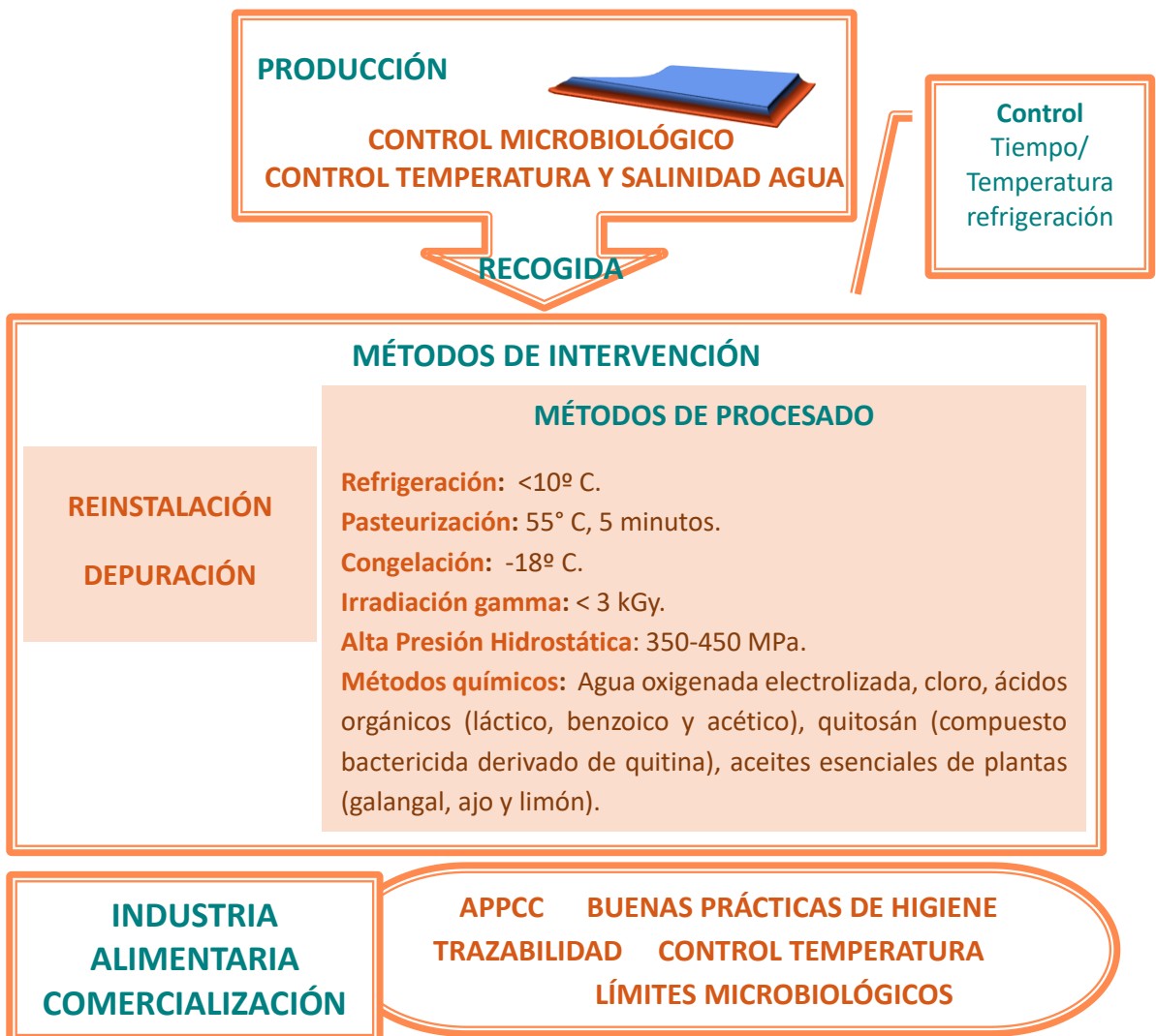
Fig. 2: Medidas de Prevención y Control en la cadena alimentaria

La Figura 2 muestra de forma esquemática las medidas de prevención y control a lo largo de la cadena alimentaria desde la producción y cosecha del marisco hasta el consumo señalando los métodos de procesado más habituales y los puntos críticos en la industria y la comercialización (17, 43, 66, 71, 72, 73). El mantenimiento de la cadena del frío y las buenas prácticas de higiene por parte de los manipuladores de alimentos son fundamentales para garantizar la inocuidad del producto (69).