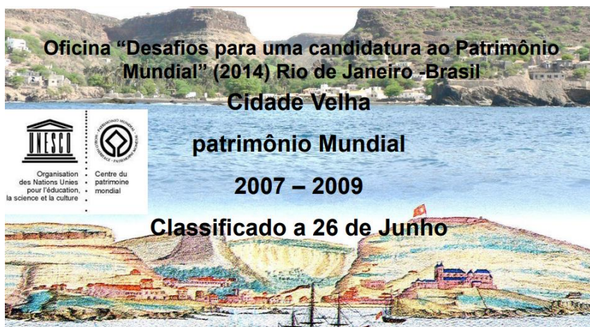
Figura 10: portada del dossier de la candidatura de la Cidade Velha.