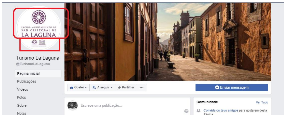
Figura 16: Página de Facebook del ayuntamiento.