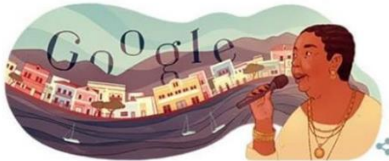
Figura 6: Doodle Cesária Évora; Homenaje Google