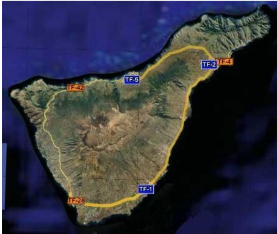
Figura 3: carreteras tf1 tf2 y tf5