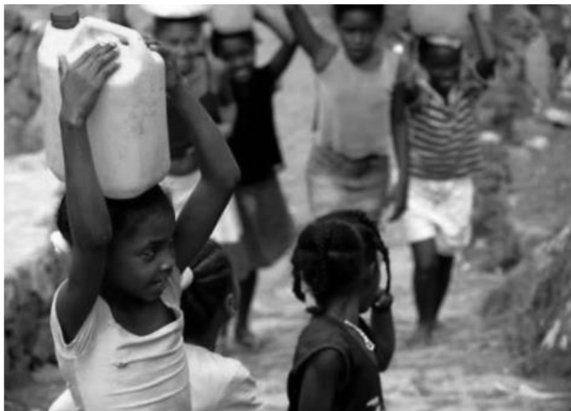
Figura 9: Niños; Transporte de agua – Población y Actividad económica primaria

Las fotografías de los niños suelen ser muy representativas, frecuentemente aparecen como un icono. Pritchard y Morgan (2003) afirman que tradicionalmente las imágenes para mostrar a las poblaciones indígenas, suelen ser los niños, en representación de la inocencia y los ancianos, como representación de la sabiduría. Ambas imágenes son difícilmente susceptibles de causar incomodidad al turista.