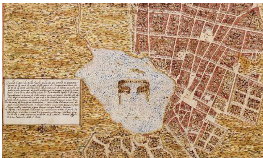
Figura 1: Plan urbanístico Leonardo Torriani (1588)

El centro Internacional para la Conservación del Patrimonio – CICOP explica en análisis de transición de la arquitectura que, la ciudad de La Laguna fue fundada a principios del año 1496, en una llanura alejada del mar. En una zona elevada entre vertientes por razones estratégicas, el conquistador Adelantado creía que la lejanía de la ciudad del mar prevenía de ataques de piratas, a la vez que fortalecía las relaciones en el interior. La ciudad estaba sin embargo situada junto a una laguna insalubre. La presencia de esa laguna está confirmada por la documentación histórica y además aparece dibujada en uno de los primeros mapas cartográficos de gran valor para el conocimiento de la ciudad originaria realizado por Leonardo Torriani (1588). Ver figura 1.