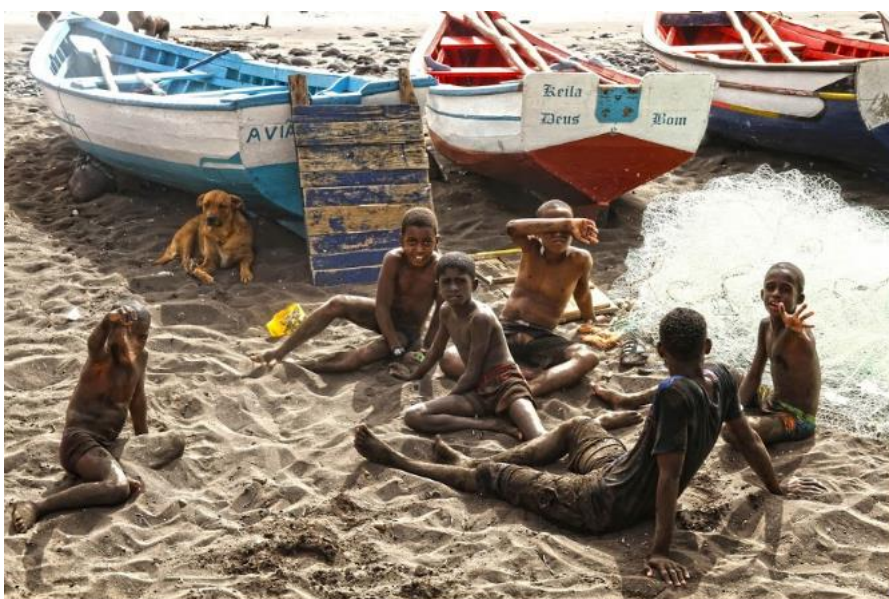
Figura 8: Niños y barcos pesqueros – Población y Actividad económica primaria

La “población y sus costumbres” son elementos súper representativos a la hora de difundir la imagen de una ciudad viva en cultura y tradiciones. Cidade Velha es una ciudad que todavía la población encuentra como su principal medio de subsistencia la actividad económica primaria, y en base a esa medida, la vida humilde existente en ese territorio, culmina con la preservación de las costumbres y las actividades tradicionales conservadoras. Este hecho es muy representativo en las fotografías que han terminado de alguna forma de protagonizar la imagen de la Cidade Velha, y la actividad turística está aprovechando de eso para representar a la Cidade Velha en sus páginas web ( https://www.soltropico.pt ).