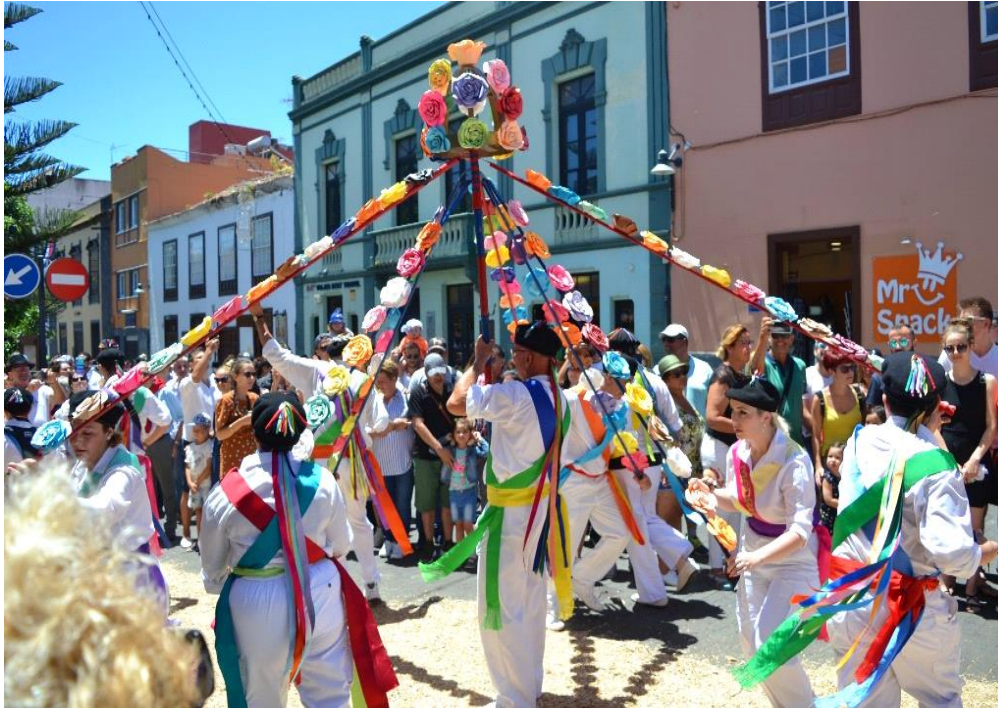
Figura 4: Romería S. Benito;