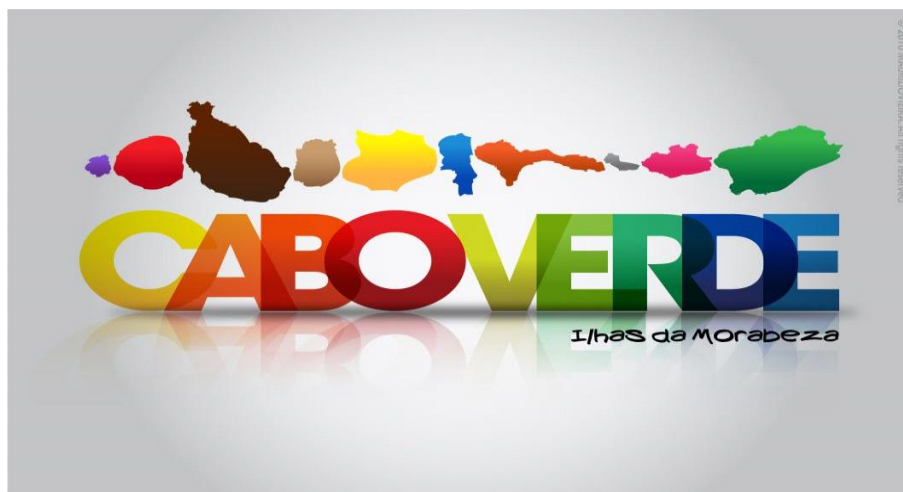
Figura 5: Marca Turística de Cabo Verde

Cada letra de la marca Cabo Verde esta en colores distintos, simbolizando a variedad paisajística y singularidad de cada isla, como muestra la figura 5.