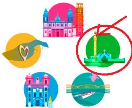
Figura 11: Proyecto internacional - rede city2020