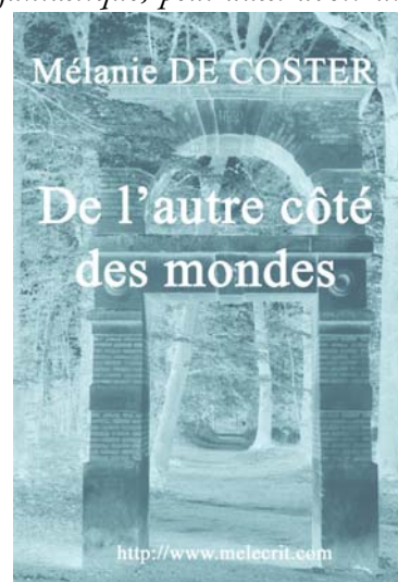
De l'autre côté des mondes. Paris, L'Harlequin, 2006

Oui, et cette faculté d'éveiller les consciences fait partie des innombrables bénéfices non seulement de la littérature mais des arts en général, comme le cinéma. En rapport avec cela, quand j'ai lu De l'autre côté des mondes , il y a eu des scènes du film hyper lauréat et admiré, Avatar (2009), de James Cameron, qui me sont venues à l'esprit. C'est vrai que les mondes parallèles (le multivers) sont une constante en littérature fantastique et en science-fiction depuis Isaac Asimov ( The Gods Themselves , 1972) Stephen