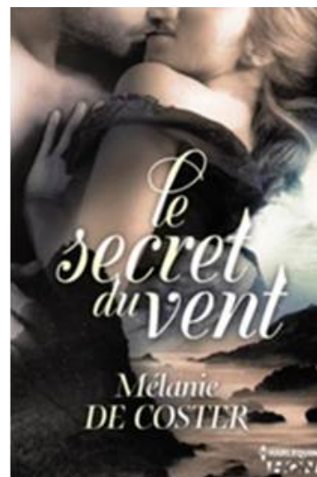
Le Secret du vent . Paris, Harlequin, 2014

Pour aller plus loin, prenons l'exemple de votre dernier roman, Le Secret du vent (2014), dans lequel le choc entre les deux genres choisis est, de mon point de vue, énorme, parce que bien que tous les deux opèrent dans le domaine du subjectif et qu'ils parlent des forces irréprouvables, la romance (qui a été traditionnellement exclue du canon littéraire en raison de son portrait des sentiments passionnés et amoureux presque sans intrigue alternative) remémore les émotions humaines les plus heureuses et parfois douloureuses, les maux de cœur, tandis que le fantastique évoque les sentiments les plus extrêmes et inquiétants: l'anxiété, le mystère, les énigmes, la peur... Quelle est la valeur que la fantaisie ou le merveilleux peut surajouter aux intrigues amoureuses ?