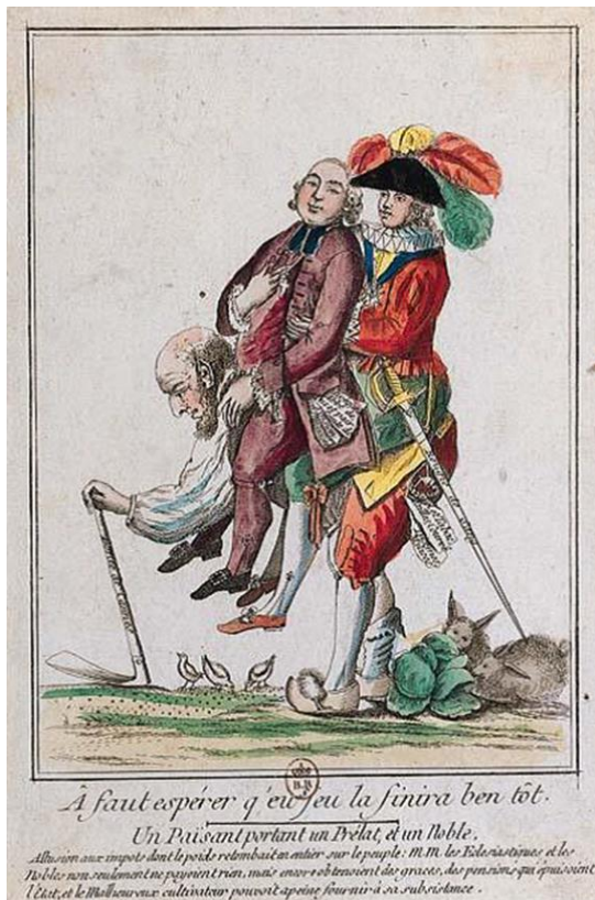
À faut espérer q'eu jeu la finira ben tôt. Un Paysant portant un Prélat, d'un Noble. Allusion aux impôts dont le poids retombe en entier sur le peuple. M.M. les Evêques et les Nobles non seulement ne payent rien, mais encore s'obtiennent des grâces, des pensions qui nuisent l'État, et le Malheureux cultivateur pourroit apporter secours à sa subsistance.

Caricature XVIII e siècle, anonyme (Gallica, Bibliothèque nationale de France) Nous avons aussi contemplé les mots cooccurrents les plus fréquemment utilisés dans le voisinage de notre mot, car eux-aussi ils jouent un rôle dans la détermination du sens. Cette approche débouche logiquement sur une sémantique associative et selon François Rastier (1989 : 258) il s'agit d'un point essentiel d'analyse qui marque le passage de l'analyse plutôt quantitative vers l'analyse qualitative. Le sémanticien français (Ras-