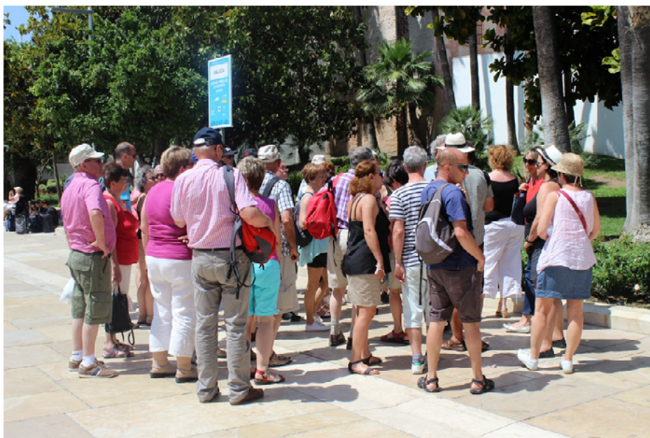
Imagen 1. Turistas en el centro de Málaga. 2019.

La delicada relación entre turismo cultural y sostenibilidad habla de la correcta planificación y gestión de nuestro patrimonio histórico cultural vinculado al turismo, y este se convierte en clave para la acción sobre el patrimonio. La planificación de un modelo de desarrollo del turismo cultural en una ciudad debe tener muy presente que la actividad turística ha de ser una actividad económica regida por los principios de calidad y sostenibilidad, capaces de contribuir al mantenimiento y la conservación del patrimonio cultural, evitando el deterioro de los bienes culturales y respetando condiciones de habitabilidad (Ruiz, 2014, p. 239).