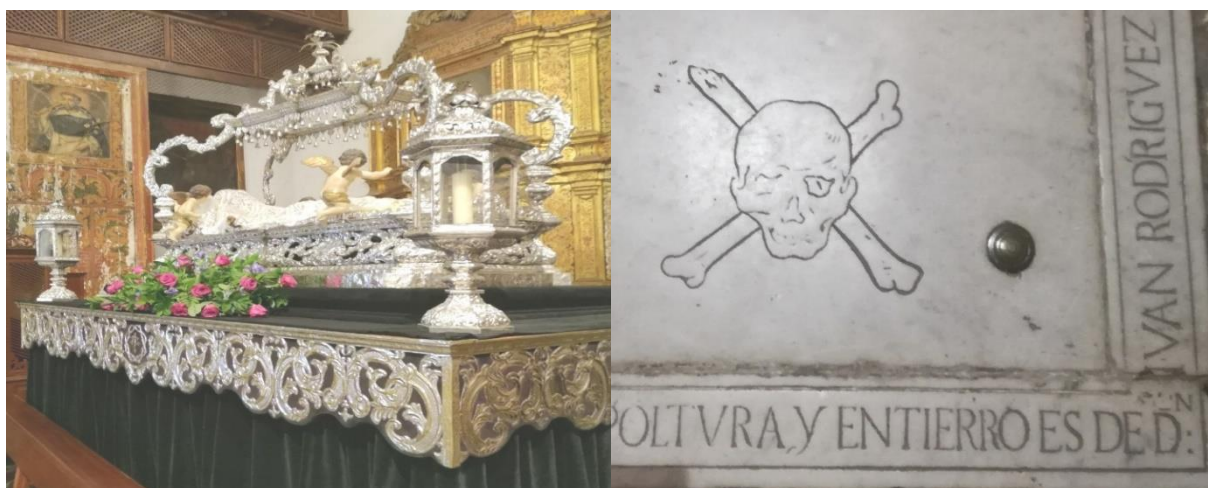
Urna de plata para el Santo Entierro, sufragada por Amaro Pargo, y detalle de la lápida de la cripta familiar. Iglesia de Santo Domingo (La Laguna)

Amaro Rodríguez Felipe, aquejado de determinadas dolencias y necesitado de descanso, pasó los últimos años de su vida en su confortable hacienda de La Miravala, en Tejina, y solo se trasladó a La Laguna movido por la seguridad de contar con los mejores profesionales de la sanidad y la medicina. Otorgó el tercero y definitivo de sus testamentos en 1746, falleciendo en la entonces capital el 4 de octubre de 1747. Con su desaparición definitiva La Laguna, Tenerife y las Islas en general perdían con él no solo a uno de sus más firmes valedores sino a un referente en el horizonte económico-social. Su leyenda se iría acrecentando con el transcurso de las generaciones, que recordarían la grandiosidad de sus mayorazgos, de sus posesiones, engalanadas en la memoria con el relato exótico de aventuras corsarias en los mares del Caribe.