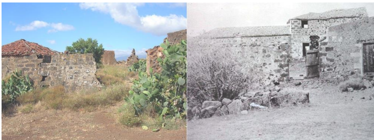
Comparativa del estado de la hacienda de Toriño (Machado, El Rosario) entre los años 60 del s. xx y la actualidad.

nuos asaltos de los corsarios extranjeros, pasando por incontables donaciones en metálico y en bienes a los diferentes templos y conventos de su localidad natal y enclaves cercanos. Su religiosidad, acentuada con el paso de los años, le llevaría a donar el valioso aceite necesario para la liturgia de las iglesias en Tenerife, sustancia que no en pocas ocasiones faltaba en la realidad eclesial del momento, tal y como reza en muchos libros parroquiales. Un apartado a todas luces interesante y aleccionador fue el apoyo indubitado de Amaro Pargo tanto a los niños expósitos como a los pobres de la cárcel, comunidades marginales ambas a las que dedicó enormes cantidades de dinero y de esfuerzo para tratar de mitigar sus penosas realidades.