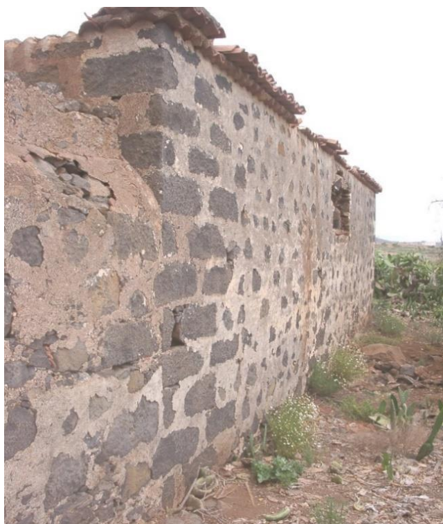
Rincón de la casa del Pirata, en Machado (El Rosario)

nuos asaltos de los corsarios extranjeros, pasando por incontables donaciones en metálico y en bienes a los diferentes templos y conventos de su localidad natal y enclaves cercanos. Su religiosidad, acentuada con el paso de los años, le llevaría a donar el valioso aceite necesario para la liturgia de las iglesias en Tenerife, sustancia que no en pocas ocasiones faltaba en la realidad eclesial del momento, tal y como reza en muchos libros parroquiales. Un apartado a todas luces interesante y aleccionador fue el apoyo indubitado de Amaro Pargo tanto a los niños expósitos como a los pobres de la cárcel, comunidades marginales ambas a las que dedicó enormes cantidades de dinero y de esfuerzo para tratar de mitigar sus penosas realidades.