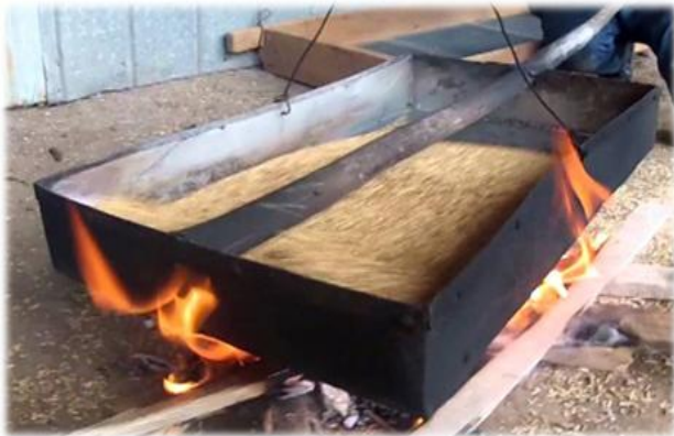
Ansina lo tuesta , Cho Juan Perinál...