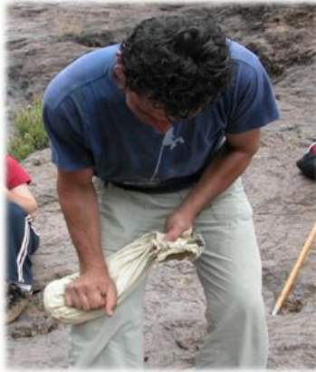
Ansina lo amasa , Cho Juan Perinál...