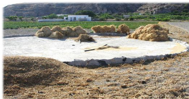
Lo bota en la era , Cho Juan Perinál...