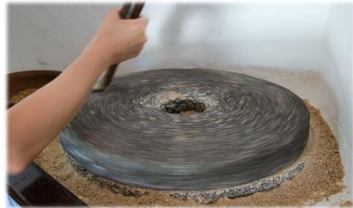
Ansina lo muele , Cho Juan Perinál...