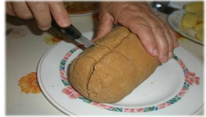
Ansina lo come , Cho Juan Perinál...