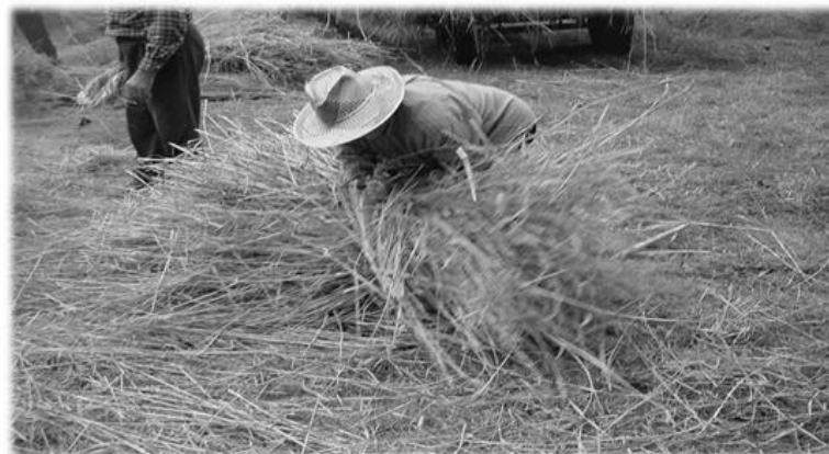
Ansina lo empega , Cho Juan Perinál...