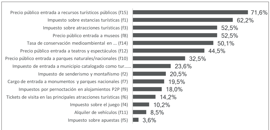
Figura 1: Disposición a pagar figuras tributarias y/o precios públicos