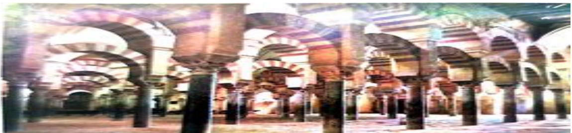
Fuente: Ciencias Sociales 5 Educación Primaria. Proyecto Más savia . Ed. SM

En este ciclo, la editorial apuesta por imágenes reales de los monumentos andalusíes con los que hoy en día contamos como la Alhambra de Granada o la Mezquita de Córdoba.