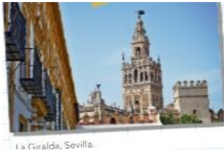
La Giralda, Sevilla.