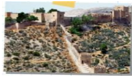
Alcazaba y murallas del Jaén, Almería.