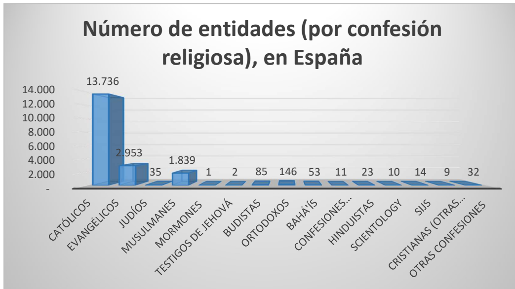
Gráfico 1 3 :

Podemos comprobar la coexistencia de una multitud de entidades religiosas, vinculadas a más de 15 entidades religiosas (hay que precisar, la existencia de dos grupos que amalgaman a un conjunto de entidades: “otras confesiones cristianas” y “otras confesiones”).