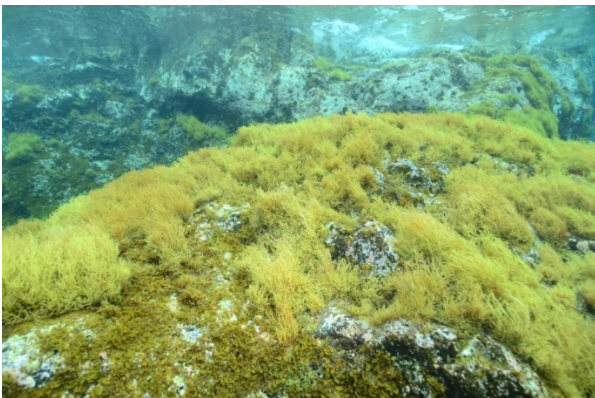
Figura 7. Cystoseira abies-marina , submareal de las Islas Canarias.

extendido a las especies formadoras de bosques del litoral Atlántico peninsular. Además, la explotación para el consumo de estas especies es creciente, particularmente en Galicia. En esta comunidad autónoma, igual que en el resto, la extracción de algas está regulada por ley, pero el programa de extracción no considera unos planes específicos adecuados a la situación de las poblaciones naturales y las características biológicas particulares de cada especie, como sería deseable (ej. Frangoudes 2011). El caso contrario se da en el País Vasco donde se ha prohibido la extracción de G. corneum debido a su vulnerabilidad. Para esta especie se ha demostrado científicamente que su resiliencia ante el cambio climático se ve mermada en algunas zonas por la explotación y otras presiones antropogénicas, lo que reduce su recuperación ante eventos de estrés (Borja et al. 2013).