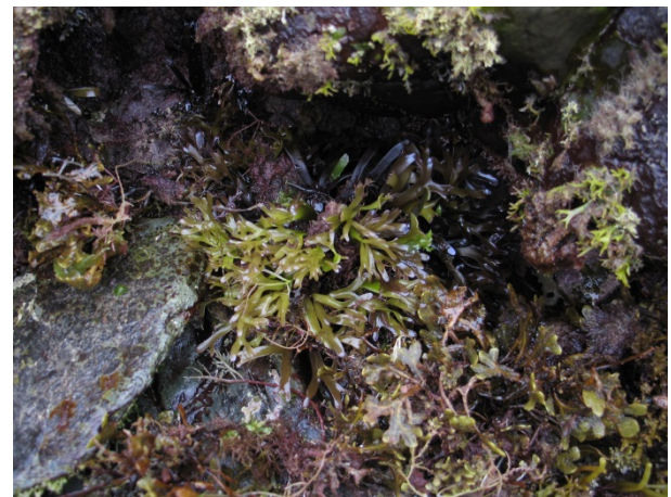
Figura 2. Chondrus crispus asociado a grietas, Cadavedo, Asturias.

que dominaba el litoral rocoso inferior, solo persisten algunos ejemplares aislados en grietas (Fig. 2).