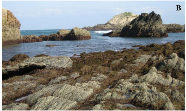
Figura 1. Cambios temporales en la cobertura de macroalgas en Porcía, Asturias: A) población abundante y reproductora de Himanthalia elongata en el año 2000; B) ausencia de H. elongata en el año 2008.

Como se ha mencionado, en la zona central de la Cornisa Cantábrica han desaparecido densos bosques submarinos formados por Laminariales que dominaban las costas rocosas de Asturias y el oeste de Cantabria. Las especies de aguas más frías como Laminaria hyperborea y Saccharina latissima no están ya presentes, y las más termotolerantes como Laminaria ochroleuca y Saccorhiza polyschides están actualmente en una fase de fuerte regresión (Fernández 2011, Voerman et al. 2013). Las algas pardas del grupo de las Fucales que cubrían las rocas intermareales de localidades semiexpuestas y protegidas al oleaje, también han visto reducida drásticamente su abundancia desde principios del actual milenio (Fernández & Anadón 2008, Viejo et al. 2011, Lamela-Silvarrey et al. 2012, Duarte et al. 2013). Merecen una especial mención los casos de Fucus serratus , F. vesiculosus y Ascophyllum nodosum , que prácticamente han desaparecido del Norte de España, aunque poblaciones locales pueden subsistir (Viana et al. 2014) como es el caso de A. nodosum en Cantabria (Ginda, com. per.). Algo similar ha sucedido con Chondrus crispus , el “musgo de Irlanda” usado en la industria como fuente de carrageninas y explotado comercialmente en la costa occidental de Asturias hasta finales del siglo pasado. De esta rodofícea