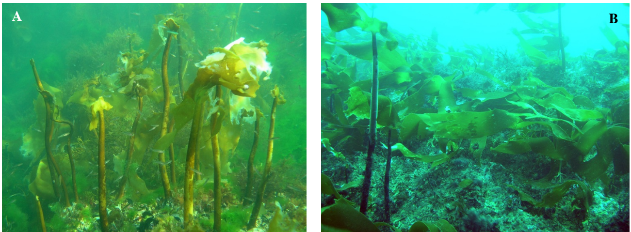
Figura 6. Laminaria ochroleuca en el submareal de Galicia: A) ría de A Coruña 2007; B) Ribadeo 2013.

Las especies afectadas son típicas de aguas templado-frías siendo el norte de la Península Ibérica su límite meridional de distribución en aguas atlánticas europeas (Bárbara et al. 2005, Araújo et al. 2009). Desde finales del siglo XIX se han observado sucesivas retracciones y