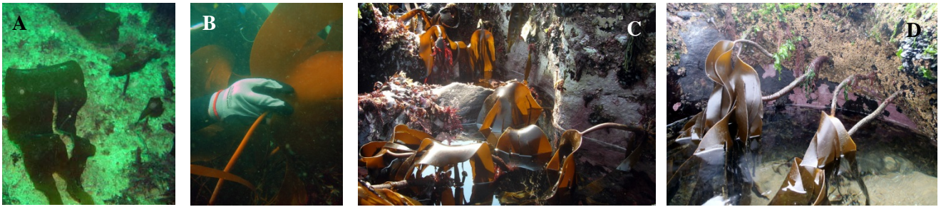
Figura 4. Laminaria hyperborea en Galicia y Norte de Portugal: A) ejemplares pequeños en el submareal (20 m) de la ría de Vivero; B) ejemplares de mayor tamaño en el submareal somero (8 m) de la ría de Camariñas; C y D, población del intermareal inferior que se mantiene constante (2006 y 2013) en Vila Chá.