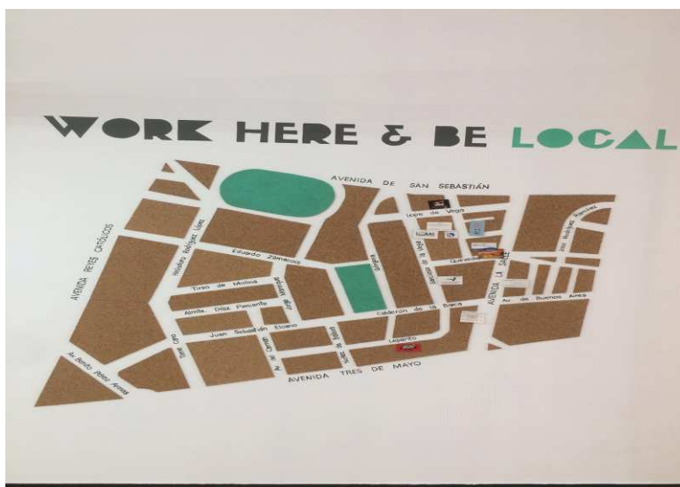
Figura 6. Mapa del barrio La Salle, situado en el espacio Local Coworking.