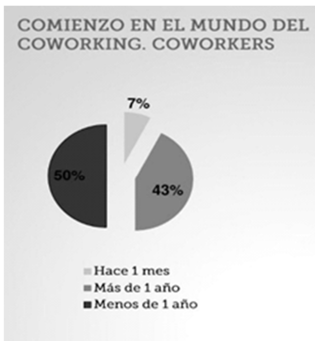
Figura 7. Página: www.coworkingspain.es

Punto 5- Acudieron también dos ponentes del Coworking Utopic Us , adquiriendo importancia ya que al hablar ellos mismo dejaron claro que no se autodefinen como tal, sino que hablan de una transformación creativa, presentan proyectos, se comentan todo, critican las estrategias de precio y como fijar los precios en los coworking , hablan de si realmente hace falta poner varias tarifas; qué precio debería ponerse ya que están en función de todas las cosas que ofrezcas. ix