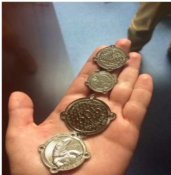
FIGURA 4. Babeles, moneda propia del Arca de Babel.

Entre ellos se promocionan para así obtener un recurso mayor. En el Arca de Babel tienen promociones para incentivar a la compra de babeles ya que por 50€ nos darían 55 babeles. Ejemplo de estas monedas que ellos mismos crearon para su espacio coworking :