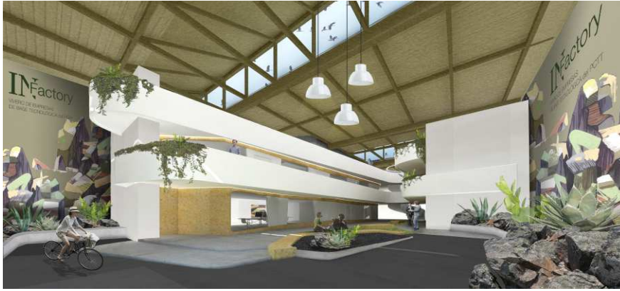
Figura 10. Maqueta de Coworking público situado en la Dársena Pesquera.

Después de investigar y analizar detalladamente qué es coworking , llegamos a la conclusión de que no es un espacio en sí sino lo más importante es quien está dentro de ese espacio ya que esa es la verdadera esencia del coworking ; aprender de los demás y que éstos aprendan de ti llegando a crear grandes proyectos juntos.