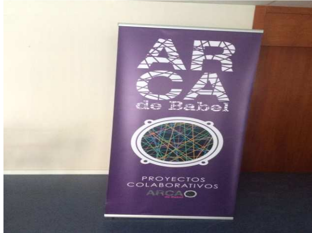
Figura 3. Cartel situado en el espacio Arca de Babel

Su espacio ofrece un lugar de trabajo, con Internet de fibra óptica, una zona común para el café, sala de reuniones, etc. El Arca de Babel cuenta con un modelo empresarial, ya que no es únicamente de una persona sino que hay bastante gente involucrada en este proyecto.