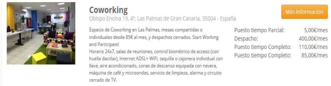
Figura 2.

Si nos centramos en Canarias, en la provincia de Las Palmas de Gran Canaria, tenemos el siguiente espacio coworking , notándose los precios aún más económicos que en el exterior de las Islas: