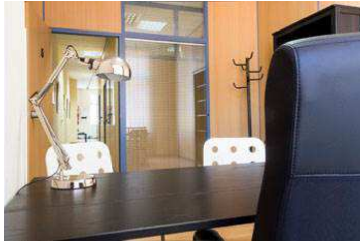
FIGURA 5. Despacho del Coworking Laguna.