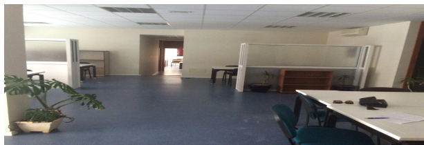
Figura 1. Coworking Arca de Babel.

La concepción del trabajo compartido surge sobre finales del siglo XX, aproximadamente, cuando en 1995 se funda uno de los primeros “ hackerspaces ” del mundo, concretamente, en Berlín, siendo un lugar físico donde las personas se conocían y pasaban a trabajar en grupo.