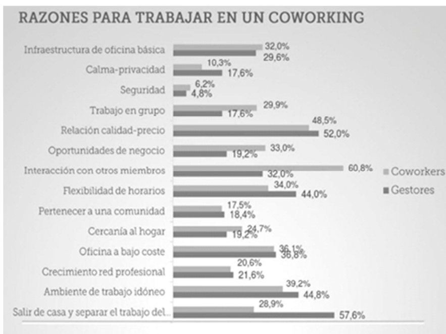
Figura 9: Página www.coworkingspain.es

En esta segunda gráfica observamos que más de la mitad de los actuales coworkers trabajaban antes en casa. Algo más del 19% trabajaban en una oficina propia o alquilada. La minoría de encuestados trabajaban antes en una oficina por cuenta ajena.