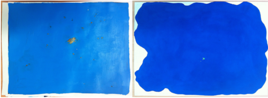
Figura 6. Mapas identitarios de estudiantes del Máster en Arte: Idea y producción. Santiago Navarro.

tendría la doble tarea de «radicalizar» algunos modos e intereses del estudiante para afianzarlos en su lenguaje, a la par que mostrarle los extremos opuestos a su creación-pensamiento para ejercitarlos y enriquecer sus recursos.