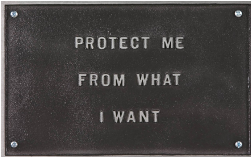
Figura 1. Protect me from what I want_Jenny Holzer (1983-1985).

ello hacen uso de una metodología híbrida basada en la autocepción de sus participantes combinada con procesos de investigación artística e investigación narrativa a través de herramientas de recopilación visual diaria (figura 1).