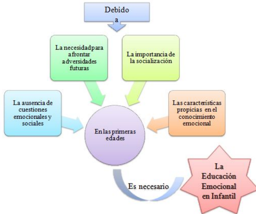
Figura 1. Razones de la Educación Emocional en Infantil