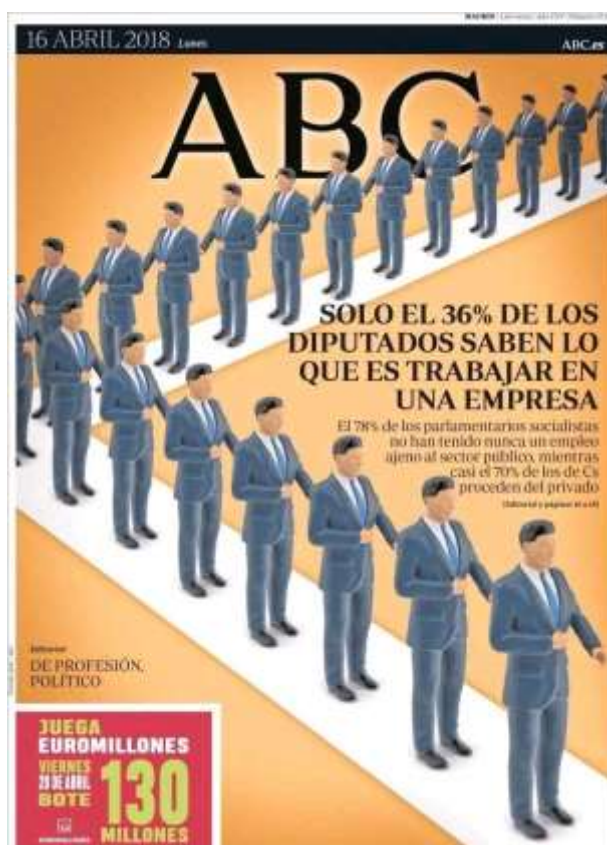
Imagen 1. Portada de ABC del 16 abril de 2018, donde se muestra solo figuras masculinas con el titular “Solo el 36% de los diputados saben lo que es trabajar en una empresa”. Un ejemplo del borrado mediático de las políticas.

Por tanto, el análisis del discurso emitido en los medios nos permite describir y evaluar los significados compartidos de nuestra cultura occidental a través del escrutinio, en detalle, de las representaciones del mundo social que predominan (Mathenson, 2005). En el caso de las mujeres con poder, la portada del periódico ABC que se adjunta en la imagen 1 puede ser un ejemplo de cómo el campo de política es considerado socialmente ajeno a las mujeres.