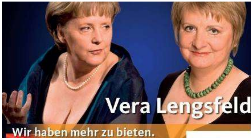
Imagen 3. Fotocomposición realizada por Vera Lengsfeld sin el permiso de Merkel.

En conclusión, da igual qué hagan (o cómo se vistan) las mujeres con poder ni cuál sea su nivel de responsabilidad, dado que siempre estarán expuestas a la mirada y al deseo masculino, constituyendo aún esa “Alteridad” que describía Simone de Beauvoir (Beauvoir, 2015: 413) en la primera mitad del siglo XX, cuando hablaba de que la niña que se transforma en mujer “es percibida por el otro como una cosa: en la calle la siguen con la mirada, se comenta su anatomía [...]”. Y valga este último ejemplo, de los miles que hay, para que veamos hasta qué punto las políticas no son respetadas por su trabajo y gestión y se las considera externas al poder, meros objetos decorativos expuestos a los objetivos de los medios para el solaz masculino del columnista de turno.