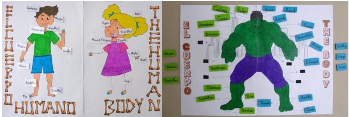
Figura 5 — El cuerpo humano: Personajes , 2016 Figura 6 — Representación del cuerpo humano: Hulk , 2016. Grado de Maestro en Educación Primaria