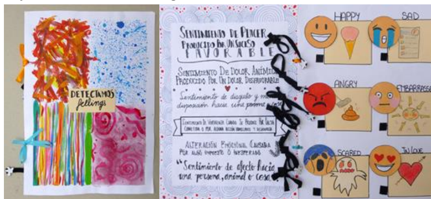
Figuras 3 y 4 — Detectamos feelings , 2016. Grado de Maestro en Educación Primaria