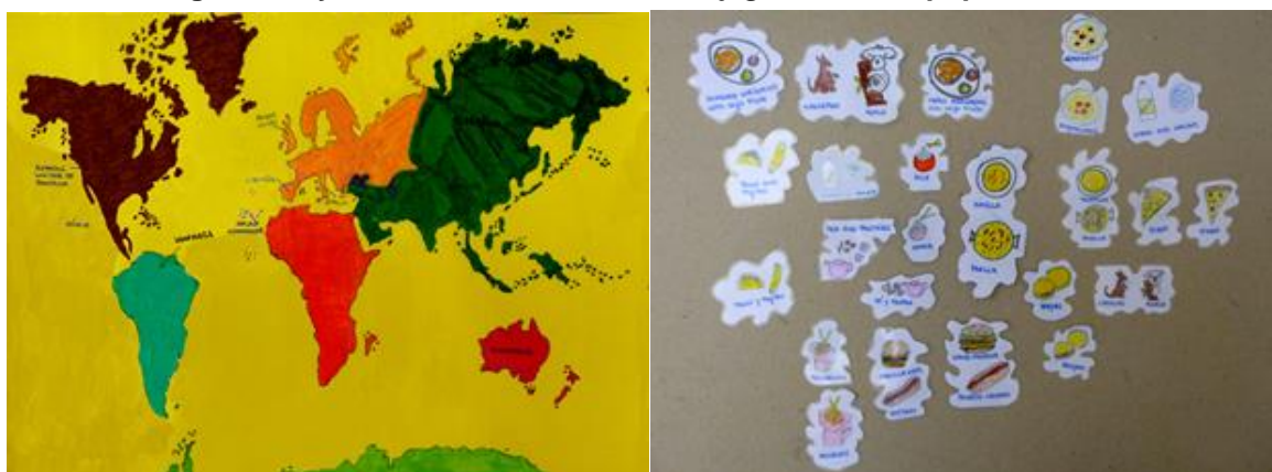
Figuras 11 y 12 — Diario Visual: Países y gastronomía popular, 2016