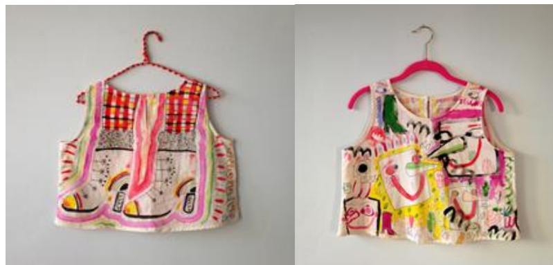
Figuras 1 y 2 — Camisas pintadas a mano, 2018. Isa Beniston