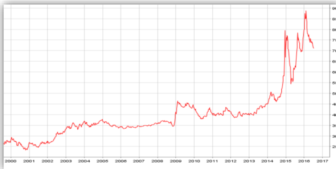
Evolución del tipo de cambio de euro a rublo