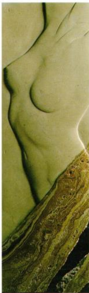
Mármol crema con incrustaciones de ágata.