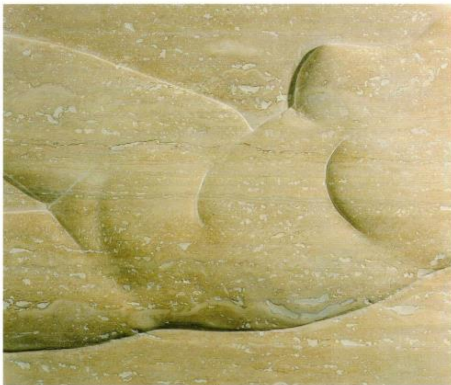
Travertino Romano. 50x58 cm 1993