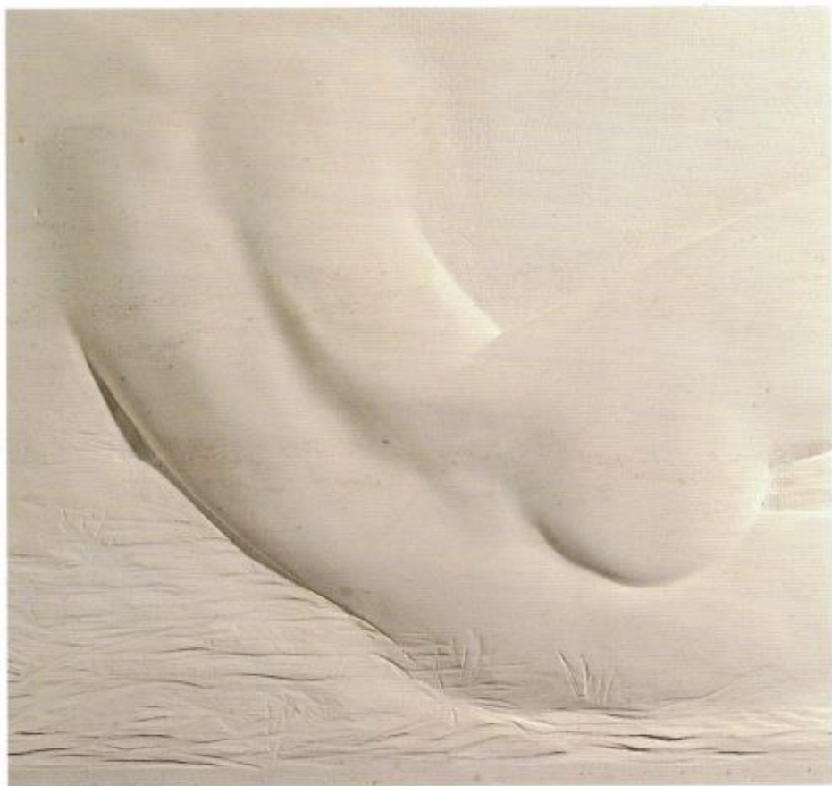
Caliza de Cabra. 54x50 cm 1994