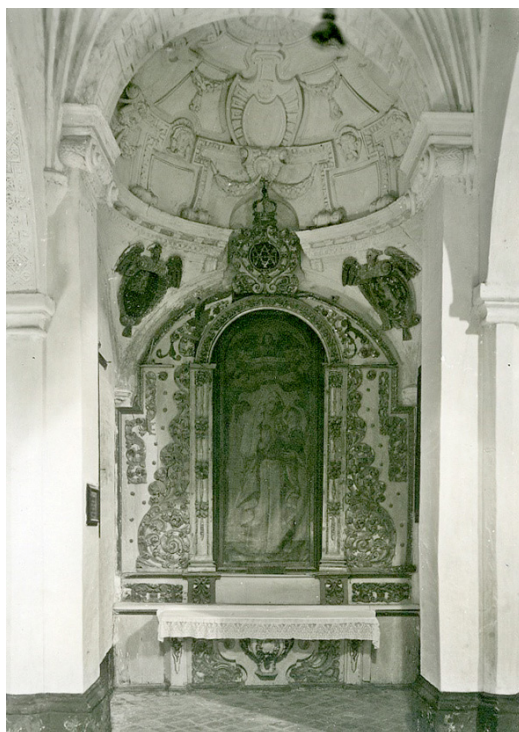
Fig. 1. Capilla de Nuestra Señora de la Antigua, iglesia de San Zoilo, Antequera.

compuesta por los siguientes cuerpos: sotobanco, banco, cuerpo, ático y remate. A continuación, pasamos a describirlos: