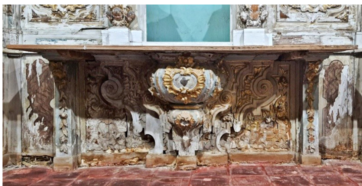
Fig. 5. Sotabanco del altar de la Virgen de la Salud, iglesia parroquial de Santiago, Antequera.