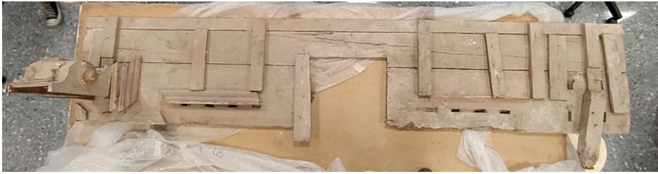
Fig. 9. Planta inferior de la mesa de altar del retablo de la Virgen de la Antigua, en la que se observa, además de diferentes elementos constructivos, el vano donde debiera ubicarse el ara en la antigüedad.

mesas de altar exentas sobre las que se celebra la eucaristía también tienen el ara en el centro, consagrado desde el momento de la bendición y consagración del templo al que pertenezca.