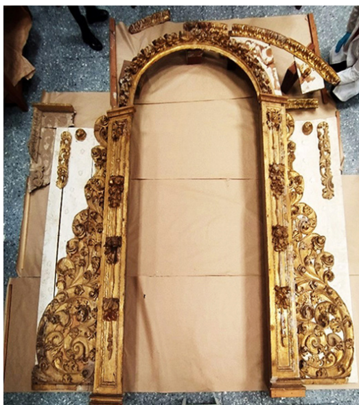
Fig. 8. Montaje físico preliminar del cuerpo y ático del retablo objeto de estudio.

tigos del paso del tiempo y sus múltiples intervenciones algunos restos que conservan los diferentes estratos policromos con los que la obra se ha podido observar a lo largo del tiempo.