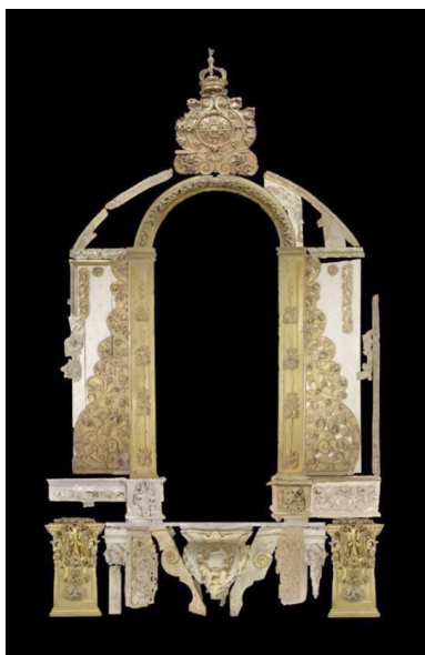
Fig. 7. Remontaje digital a escala del retablo de la Virgen de la Antigua.