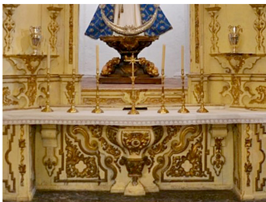
Fig. 4. Sotabanco de un retablo situado a continuación de la capilla de la Cofradía de la Sangre. Nave del Evangelio.