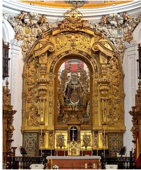
Fig. 3. Retablo de la Virgen del Socorro, iglesia de Santa María de Jesús, Antequera.

rior curvo. Además, también encontramos elementos iconográficos de guirnaldas y drapeados, del mismo modo presentes en otro retablo que presenta elementos que nos recuerda, en cierta manera, al de la Virgen de la Antigua, principalmente a los elementos formales del vano central. Se trata del retablo de San José de la misma iglesia de San Zoilo, ejecutado en la primera mitad del siglo XVIII por Antonio de Ribera, cuya figura volveremos a ver posteriormente.