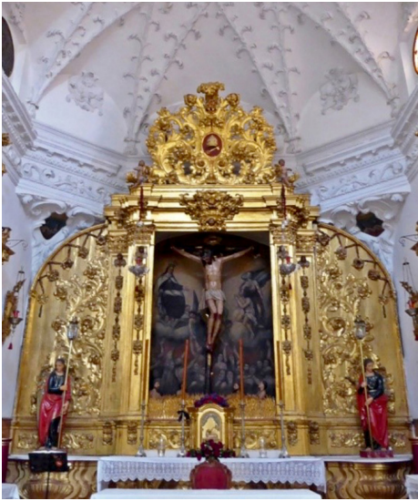
Fig. 2. Retablo del Cristo de las Misericordias, capilla de Ánimas, iglesia Parroquial de San Pedro, Antequera.