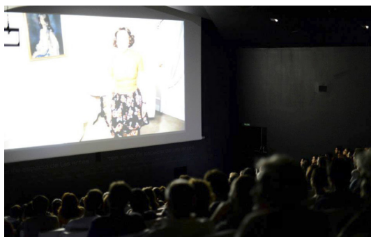
Sesión de proyección del Tenerife shorts en 2013 en la sala del TEA.

Con un formato más clásico, en octubre de ese 2013, comenzó en Gran Canaria el FIC Gáldar — Festival Internacional de Cine de Gáldar. Dirigido por la actriz Ruth Armas a través de la empresa OMF Asesores SLP, cuenta con una sección competitiva más genérica y sobre todo nacional de cortometrajes, además de otra de rodajes in situ (Gáldar Rueda), y una pequeña sección informativa con la presentación de largometrajes nacionales, además de pasacalles, muestra de cineastas grancanarios e infantiles y hasta desfiles de moda. De hecho es un festival que, como el de Lanzarote, concede mucha importancia a toda esa parte de glamour , invitados y photocall asociada a estos eventos. Por ejemplo, para asistir a la gala de clausura del 2015, desde la organización se hacían mensajes de este tipo: «IMPORTANTE: Recuerda venir vestido para la ocasión. El código de vestimenta será formal o cóctel» 24 .