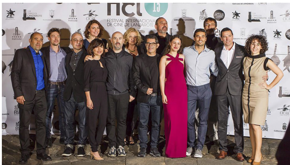
Foto de familia de Festival de cine de Lanzarote de 2015, entre otros, con los actores Javier Cámara, Aida Folch y Alex García. (Imagen: FICL).

En el mismo 2006 arrancó en Fuerteventura el Dunas — Corto Festival de Cine y vídeo / Festival de cortometrajes de Fuerteventura, organizado por el Ayuntamiento de Corralejo y dirigido por Miguel Díaz. Como en el caso del Festival de Arona — Playa de las Américas, el certamen contaba con diferentes categorías según las especialidades de los departamentos de cine, además de un premio a mejor corto canario, y contaba con abundantes galardones económicos y ayudas al traslado y estancia. Sin embargo, como en otros casos, sufrió importantes recortes de financiación, que le llevaron a plantear en 2011 una edición especial de transición sin premios, formato que se repitió en 2012, finalmente el último evento realizado.