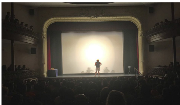
El actor Luifer Rodríguez presenta la gala de clausura del x Festivalito 2015 en el Teatro Circo de Marte, como afirmó, «el único festival que se puede presentar en cholas». (Imagen: Más o menos regular producciones).

nando a los actores. Se trataba de hacer el cine real para todos, de hacerlo cercano, fácil» 28 . En la primera edición de 2002 se rodaron 27 cortos y 35 en la segunda de 2003. En 2004, ante la avalancha de más cortos, se creó una sección informativa dentro de La Palma rueda.