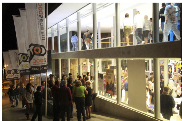
Exterior del Auditorio de Guía de Isora en la inauguración de la edición de 2012 de MiradasDoc. (Imagen: MiradasDoc).

Debido al progresivo auge de la no ficción en el contexto internacional del cine contemporáneo, el festival ha contado con una programación cuidada (sección internacional, ópera prima, nacional y canaria), secciones paralelas (más abundantes los primeros años antes de la fase más dura de la crisis), actividades educativas, invitados, etc. Destaca también la celebración paralela del Mercado de cine documental (dirigido por el cineasta y gestor David Baute), donde acuden compradores nacionales e internacionales (distribuidores, programadores de TV, etc.).