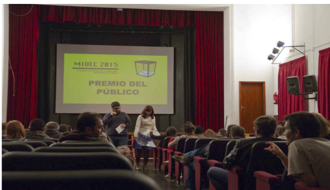
Jornada de clausura de la MIDEC 2015 con recuento del voto del público en el Salón de Actos de la Facultad de Educación de la ULL.

Es interesante constatar, así mismo, cómo más allá de este sector público o semipúblico, diferentes instituciones culturales independientes se suman a la fiebre de los festivales de cortometrajes. Nos referimos en estos casos al denominado Tercer sector, es decir, el ámbito asociativo (organizaciones privadas sin fin de lucro y con vocación de servicio ciudadano), diferentes del sector público (administraciones como ayuntamientos, cabildos, gobiernos regionales) y del sector privado con ánimo de lucro (empresas). Se trata de muestras como la del Instituto de Estudios Hispánicos o la de San Rafael en corto que se comentan en el punto 7 de este artículo. Como festival propiamente dicho, tenemos a la Asociación Cultural para el Fomento y Desarrollo de la Lectura y el Cuento que organiza el Festival Internacional del Cuento de Los Silos desde 1996. En 2005 crea una sección independiente que denomina Festival Internacional de Cortometraje Cuentometraje, que se celebra en el vecino municipio de Buenavista del Norte y que será dirigido por David Baute (quien posteriormente y como hemos visto sería el responsable del Mercado de MiradasDoc y del FICMEC). Estaba especializado en cortos basados en cuentos, con categorías de ficción y animación, además de un premio del público, en los tres casos con dotación económica. Sin embargo, solo tuvo 5 ediciones, siendo la última en 2009.