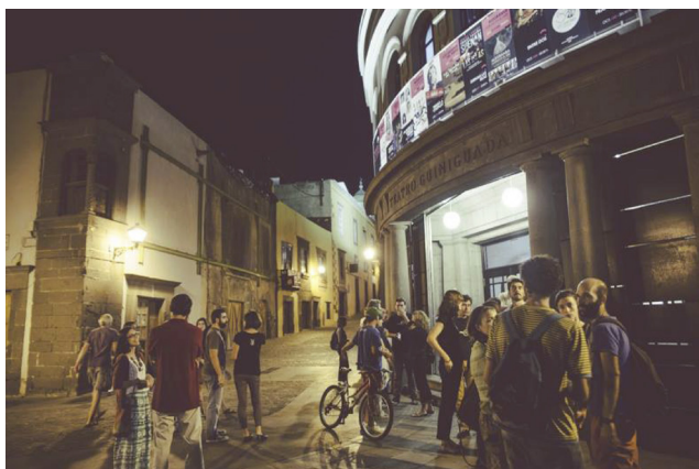
Ambiente exterior del Teatro Guiniguada antes de una de las sesiones del LPGCC en 2014. (Imagen: LPGCC).

Ya en 2014 y como «entrante» del Festival de cine de Las Palmas aparece el MMF — Monopol Music Festival para documentales musicales o sobre música, complementado con conciertos en vivo, dirigido por Víctor Ordóñez. En 2015 comienza a itinerar por Vecindario y La Laguna, y es un antecedente claro del Docurock.