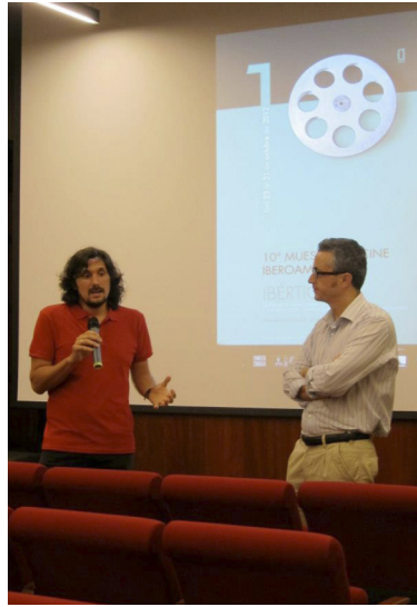
El director de cine argentino Lisandro Alonso durante un coloquio de la Muestra Ibértigo en 2012.

Cine. Por otro lado, Teodoro Ríos puso en marcha desde 1999 hasta 2005 los Screenings de cine español de Lanzarote, una reunión (de hecho las primeras ediciones se llamaban «Encuentros» en lugar de «Screenings») de tres días dirigido fundamentalmente a profesionales del cine y medios de comunicación para el visionado y compra de películas para diferentes mercados y ventanas de exhibición, aunque se completaba con proyecciones y preestrenos públicos de algunos largometrajes.