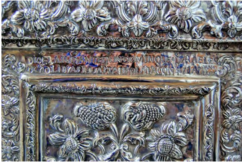
Fig. 3. Detalle del frontal del altar.

frentes bajo arcos mixtilíneos. El cuerpo cilíndrico interior lleva decoración menuda sobre fondo dorado, y se cubre con dos secciones de cúpula gallonada. El remate, hacia donde convergen los tallos de hojarasca que respaldan el tabernáculo, es una pequeña cruz, recortada en lo alto, con la imagen del crucificado 5 .