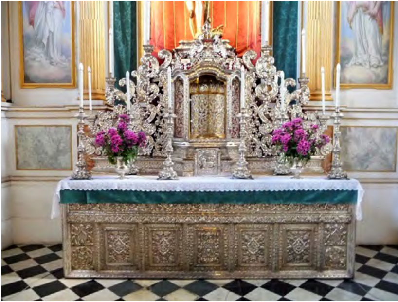
Fig. 2. Sagrario y altar de plata.

La explicación de este arcaísmo es que este frontal del altar del Cristo se había comenzado algunos años antes, incluso que el paño más antiguo del frontal de Santa Catalina 4 .