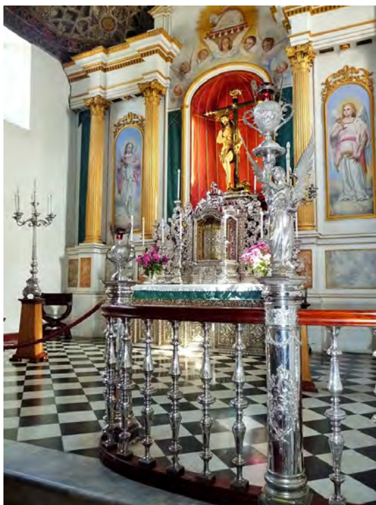
Fig. 4. Baranda y candelabros que delimitan y dividen el presbiterio.