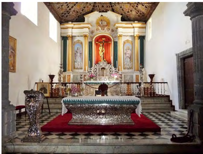
Fig. 1. Conjunto de orfebrería y plata del presbiterio del santuario del Santísimo Cristo de los Dolores, Tacoronte.

entrada al presbiterio propiamente dicho, donde se encuentra el altar y el retablo» 3 . Debemos entender con esta afirmación que con el paso del tiempo el altar cambió de emplazamiento, encontrándose en la actualidad en el primer tramo de dicha capilla, pues el actual es de hechura contemporánea, encargado por la Hermandad del Santísimo en 1999 (de este mismo año data el actual ambón).