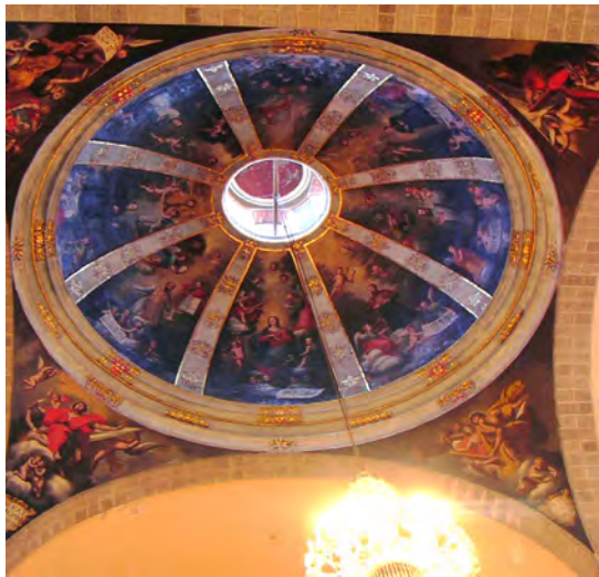
Fig. 5. Cúpula de la iglesia de San Francisco de Borja, Las Palmas de Gran Canaria.

quitectura esta circunstancia se produce en menor medida. El conocimiento de esta obra eminentemente práctica facultaba al artista para atreverse a construir bóvedas y cúpulas ajenas a la tradición lignaria canaria y situarlo dentro del escaso número de maestros conocedores de la teoría escrita en nuestro Archipiélago. No podemos