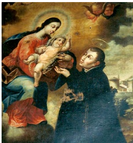
Fig. 11. San Estanislao Kostka , anónimo del siglo XVIII. Parroquia de San Juan Bautista, La Orotava.

en el oratorio. La composición está menos lograda que la anterior y es de mano diferente. El santo viste sotana y faja negras, mientras recibe arrodillado al Niño Jesús de manos de la Virgen. Se le representa joven e imberbe, ya que era la advocación de los novicios y ejemplo de jóvenes. Esta idea desarrolla la doctrina jesuita en relación con los santos recién canonizados, a los que correspondería una iconografía acorde con los objetivos a alcanzar a través de ellos. Símbolo de juventud y camino recto, san Estanislao de Kostka se presenta a veces casi como un niño immaculado que recibe la luz divina, y transmite la serenidad que aplaca la adolescencia, adquiriendo en ocasiones cierta apariencia femenina 120 . Sus representaciones parten seguramente de los grabados que realizara Galle, que ya había trabajado en las imágenes de san Ignacio que hiciera Juan de Mesa, y en los que aparece con el Niño Jesús entre sus brazos. En nuestro caso se lo representa como un joven vestido con el hábito negro característico que, de rodillas, recoge al niño de manos de la Virgen, un hecho comúnmente representado que alude a su vida de estudiante en Viena. En la esquina inferior izquierda aparecen las azucenas, atributo propio del santo que a veces porta un ángel. Se establece entre los tres personajes una línea de miradas que se cruzan con las cabezas de angelitos que desde lo alto observan la escena. La composición