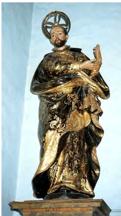
Fig. 7. San Ignacio de Loyola . Círculo de Benito de Hita y Castillo, c. 1763. Parroquia de la Inmaculada Concepción, La Orotava.