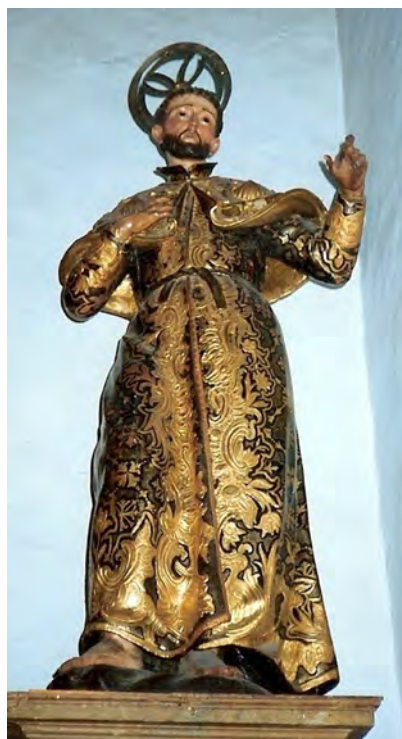
Fig. 8. San Francisco Javier . Círculo de Benito de Hita y Castillo, c. 1764. Parroquia de la Inmaculada Concepción, La Orotava.