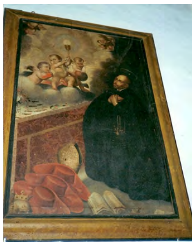
Fig. 10. San Francisco de Borja , anónimo del siglo XVIII. Parroquia de San Juan Bautista, La Orotava.

En Canarias se conservan tanto obras de Duque Cornejo como de Hita y Castillo. En el marco de los intercambios habidos con diversos lugares peninsulares, el Archipiélago tuvo una relación directa con Cornejo a través del encargo de varias obras que adornan diversos templos de las islas de Gran Canaria, La Palma y Tenerife 82 . Precisamente de Duque Cornejo es la imagen de San Francisco de Borja (fig. 10), titular de la iglesia de la Compañía de Jesús en Las Palmas, que fue encar-