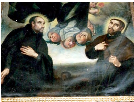
Fig. 9. Detalle del lienzo Inmaculada con San Ignacio de Loyola y San Francisco Javier , atribuido a Gaspar de Quevedo, c. 1670. Parroquia de la Inmaculada Concepción, La Orotava.

en el bello retablo de Cristo Rey, que las ha acogido muchos años. Al menos en la primera década del siglo xx estaban ya colocadas en él, donde también existe otra imagen del siglo xviii del arcángel San Miguel batiendo al demonio 79 .