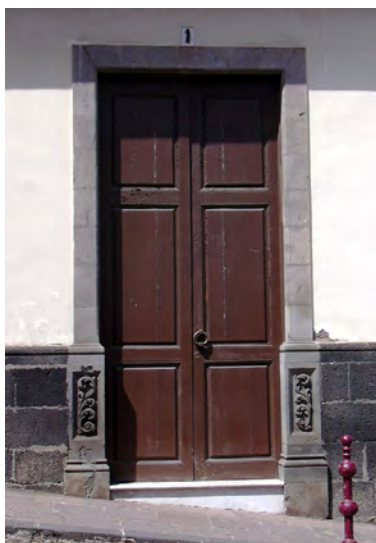
Fig. 3. Portada de la casa Díaz Flores o casa Brier , en la que se incluyeron elementos de la portada de Fernández de Torres.

Obispo de dicha Villa 27 . La reedificó desde los cimientos, aumentándole su valor hasta los « sinco mill reales » 28 . En la misma población compró a los herederos de Diego Rodríguez un « sietesito entresientos reales » 29 y una casa inmediata a este sitio a las hijas de Pedro Liño en mil setecientos reales, al parecer en el barrio del Farrobo 30 . Esto indica que preveía estar en aquella población durante algún tiempo, el que le llevaría efectuar una obra de tanta envergadura. Debió permanecer en La Orotava hasta 1742, pues entre ese año y 1746 se traslada a Las Palmas para trabajar en la iglesia que la Compañía de Jesús estaba levantando en esa ciudad, en sustitución de Alonso de Mújica y junto al ingeniero Francisco de la Pierre. Recordemos que la iglesia grancanaria había comenzado a construirse siendo rector el padre Juan Vicentelo y que este mismo jesuita lo había contratado en La Orotava. Fernández de Torres (fig. 3) se convertía de esta manera en un maestro relacionado directamente con la arquitectura jesuítica en Canarias. En esa fecha los responsables de las nuevas