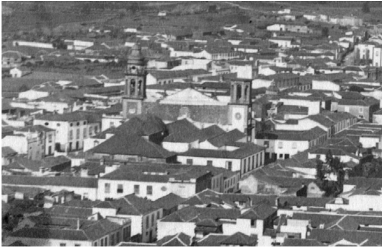
Fig. 4. Antigua iglesia de Los Remedios de La Laguna. Detalle de una postal antigua.