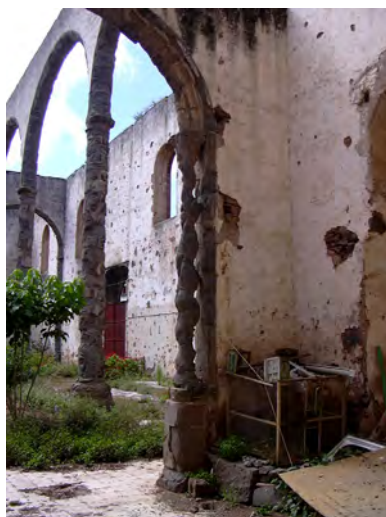
Fig. 6. Columna salomónica de la iglesia de San Agustín, La Laguna.