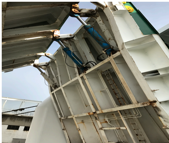
Ilustración 4: