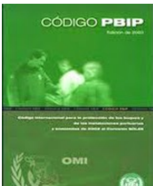
Ilustración 2: