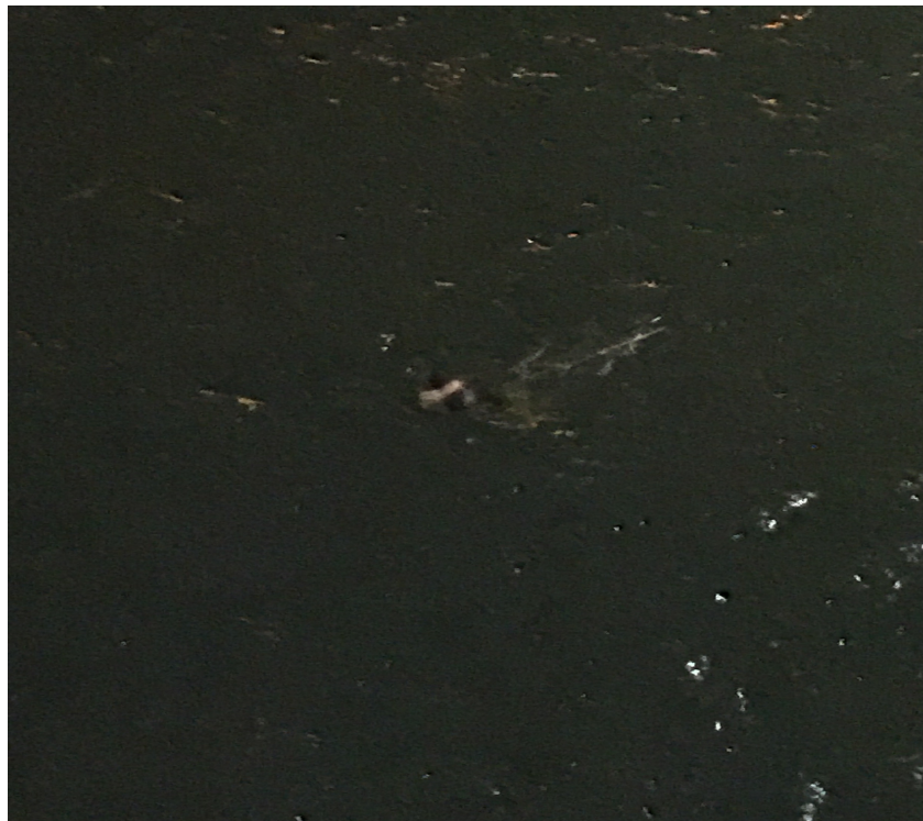
Ilustración 5:

Polizón intentando acceder al buque por el agua mediante una escala de fabricación casera.