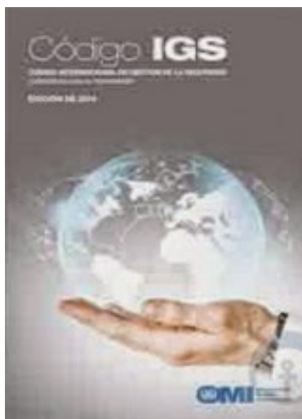
Ilustración 3: Fuente: http://conveniosmaritimos.blogspot.com.es/p/codigos-maritimos-internacionales_19.html

En este código no se habla directamente del término polizón, pero se podría incluir y de hecho esto se hace, en las disposiciones de la Parte A, sección 8, sobre la Preparación de Emergencias. En esta parte se le ordena a las compañías que “adopte procedimientos para determinar y describir las posibles situaciones de emergencia que puedan surgir a bordo, así como para hacerles frente”, además exige también a la compañía a que se suministre de los instrumentos necesarios para hacer frente a estos tipos de peligros o situaciones de emergencia.