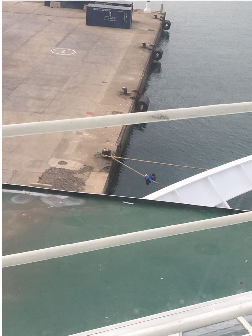
Ilustración 6: