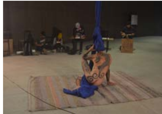
Maratón de dibujo 2016