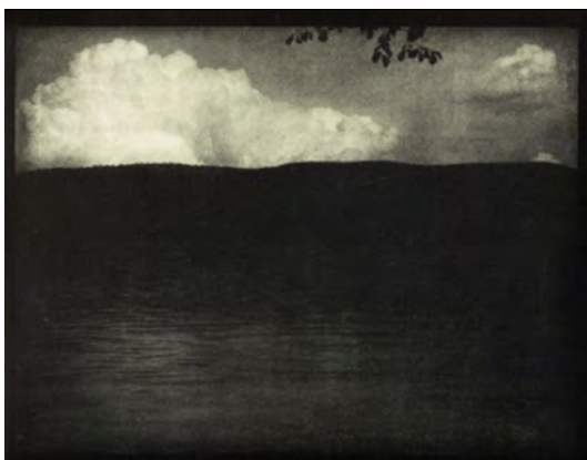
Figura 3. Edward Steichen. «The Big White Cloud», Camera Work , 1906.

Intervenir, manipular, embellecer, poetizar: esos fueron los verbos que usaron los pictorialistas para transformar la fotografía en una obra de arte.