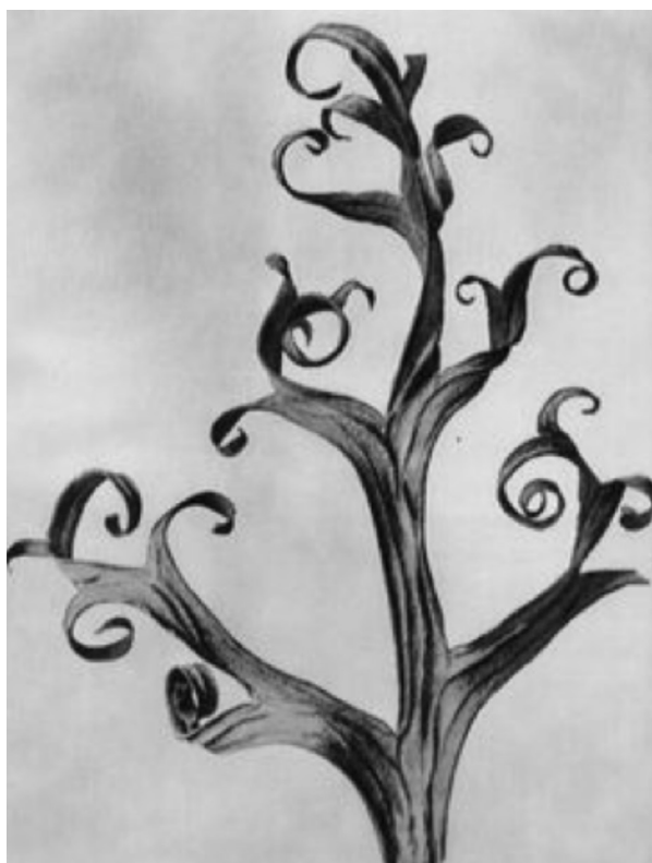
Figura 5. Karl Blossfeldt, Urformen der Kunst , 1928.

Una vez definida cada tarea, se establecieron las distintas fases de trabajo, organizadas de la siguiente forma: