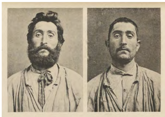
Figura 2. Alphonse Bertillon. Retrato de Y. con y sin barba, La photographie judiciaire , 1890.

Para Alphonse Bertillon y su fotografía antropométrica, el rostro de una persona era un texto que podía leerse: cada forma, cada marca era un signo de la diferencia, de la individualidad, catalogable, reducible a un tipo y comparable.