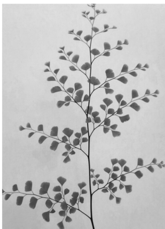
Figura 13. Daniela Esperanza Felipe Ferrer, Sin título, 2016.

Para constatar la correcta recepción de los objetivos propuestos y valorar la eficacia del proyecto de innovación se procedió a la preparación de una encuesta en la que el alumnado participante evaluó y expresó su grado de acuerdo o desacuerdo con diversos aspectos de la actividad (valoración de la experiencia, información recibida, comprensión de los contenidos teóricos de la asignatura, aprendizaje y nivel de conocimientos, potenciación del interés hacia la asignatura, tiempo de preparación y realización de las tareas, posibilidad de mejora de la tarea y corrección de errores).