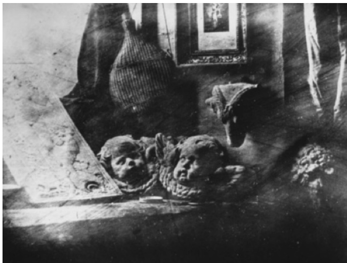
Figura 1. J.L.M. Daguerre, Daguerrotipo, 1839.

Daguerre experimentando con la fotografía: ¿Cómo podrá la luz «dibujar» la forma de los objetos?, ¿Dónde la luz se convierte en sombra, ¿Cómo se detiene el tiempo en una imagen hecha de tiempo?