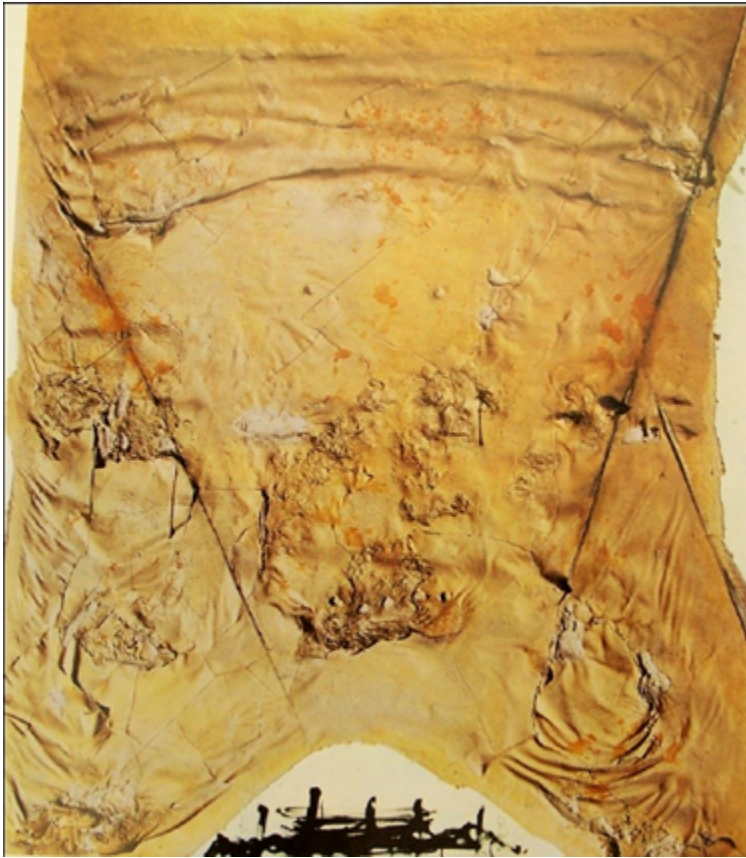
Figura 7. Materia ocre sobre tela virgen . 1969.

del cuadro como objeto y no como ventana. Sin esta saturación, nos dice el escritor, la obra de Tàpies nunca se hubiera entendido como una expresión del dolor de su tiempo. Desde este punto de vista, lógicamente, la delgada capa de barniz ofrece una visión del cuerpo más diáfana, menos convulsa, más accesiblemente bella. No obstante, como la pintura del artista catalán permite la convivencia de ideas si bien no antagónicas, sí difícilmente conciliables, también descubre Bozal síntomas que pueden inducir a una concepción no tan liviana de los delicados barnices, y aquí entra en juego de nuevo la idea de piel: capa fina de cuerpo que se ha pegado al soporte dejando bolsas de aire, transparencias, pelos y porosidades, el barniz es también el pellejo desprendido del desollado. El líquido fluyente crea ondas y pliegues, simula el peso de la piel, y de pronto su diáfana belleza se enturbia.