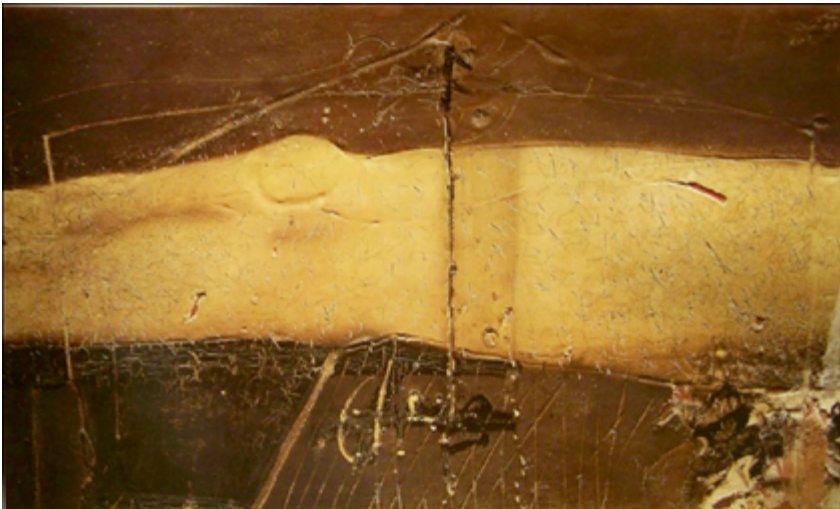
Figura 6. Materia en forma de pierna . 1968.

nos muestra una axila velluda (tanto a la axila como a la pierna incorpora Tàpies pelo real) enmarcada en la porción justa de cuerpo para ser reconocible. La carne ostenta importantes heridas abiertas. La segunda presenta una pierna igualmente lacerada, con un costurón que la atraviesa por encima de la rodilla.