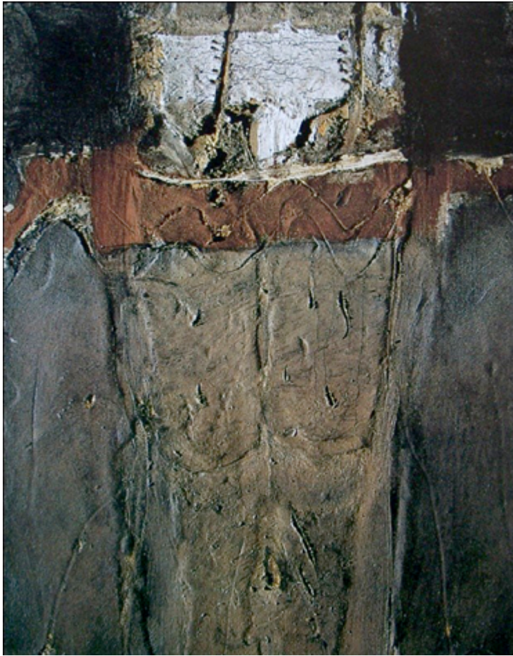
Figura 2. Forma de crucificado . 1959.