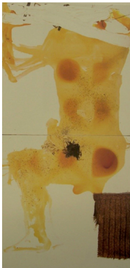
Figura 10. Transfiguración . 1994.

erosión— continuaría lo que ya parecía acabado, y haría de la forma lo informe para devolverla otra vez a su verdadera naturaleza. Con ello alcanzaría la transfiguración.