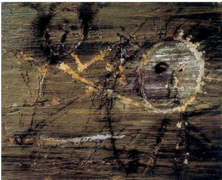
Figura 1. Composición . 1947.

primera vez enfrentado a la superficie del muro. La pintura se ha despojado otra vez de sus vestiduras, y no tardan en reaparecer nuevos vestigios de humanidad, todavía sin la entidad suficiente como para separarse de la superficie de la tapia. Así, hacia 1955, los muros comienzan a adquirir formas más orgánicas que pueden aludir a ciertas partes de nuestro cuerpo. Alexandre Cirici (6) se percató de la existencia de manchas y desconchones que conforman una especie de cotiledones simétricos evocadores de todo lo que en el cuerpo humano tiene parecida estructura: nalgas, pechos, pulmones, lóbulos cerebrales o testículos. Estas insinuaciones serán pronto evidencias en obras como Forma sobre gris (1956), muro sobre el que Tàpies dibuja un torso femenino, o Figura-paisaje en rojo , del mismo año, en la que una tapia adornada con un rectángulo rojo contiene en huecorrelieve la forma de un torso femenino de enormes y caídas mamas, como venus paleolítica. En Forma de crucificado (figura 2), de 1959, el muro es literalmente transformado en torso rectangular, y a duras penas hay hueco en la composición para la cabeza y los brazos de los que no puede prescindir cualquier crucificado que se precie. Todas ellas son carne-piedra llena de magulladuras.