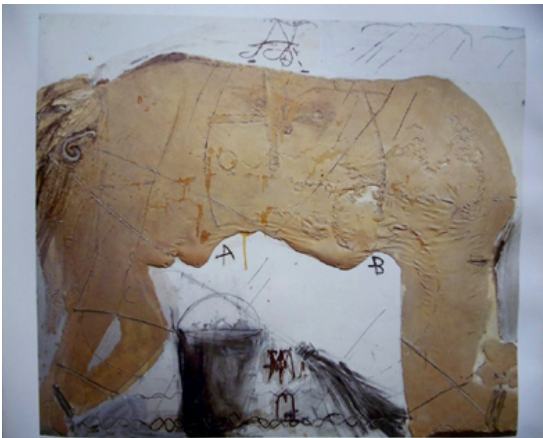
Figura 4. Desnudo . 1966.

e insiste a partir de este momento en retratar pies, axilas, ingles, anos (a menudo defecando) y pechos y piernas velludas. De paso, nos recuerda que también somos eso: pura fisicidad, suciedad, sudor y heces.