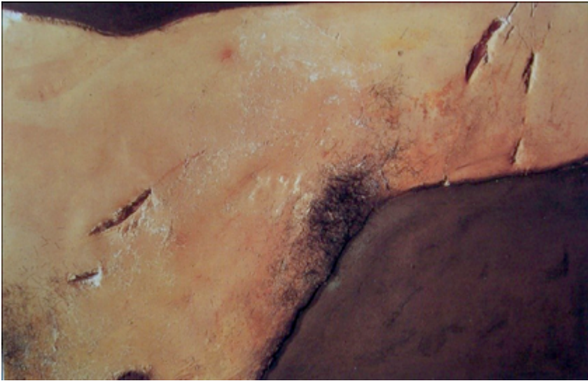
Figura 5. Materia en forma de axila . 1968.