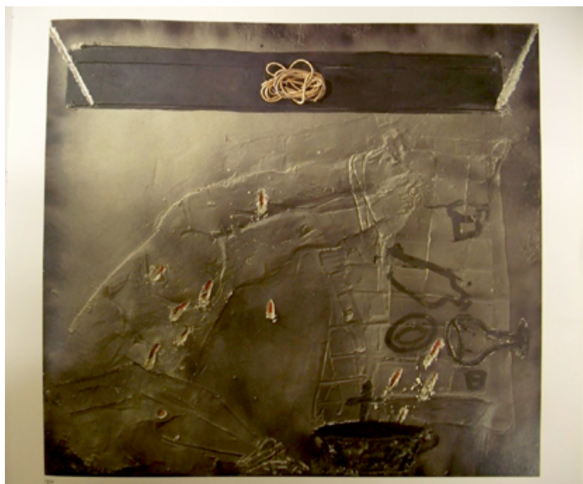
Figura 8. Composición y cuerda . 1998.

en los que los cuerpos se encuentran fuertemente ligados a la representación de la cama, pero haciendo énfasis en lo sexual y no en lo relativo a la enfermedad. Pronto se unen también figuras con apariencia de grafiti descuidado, meros contornos dibujados mediante grattage , o con espray o pincel, que no remiten ya a un cuerpo real sino a su representación sobre el soporte, como si un vándalo hubiera querido dejar su impronta sobre la obra de arte. No hay materia ni carne ni piel, y las piernas (el motivo más recurrente), los troncos y los brazos, huecos, dejan ver el fondo a su través. En ocasiones, la línea que intenta definir estas formas es tan fina, o se posa sobre un fondo tan oscuro o de materia tan potente, que los amagos corpóreos prácticamente se pierden, hundidos entre camas, mesas y cruces de presencia mucho más rotunda. Las figuras se ven absorbidas por su propio entorno sin poder reafirmarse como seres con voluntad propia.