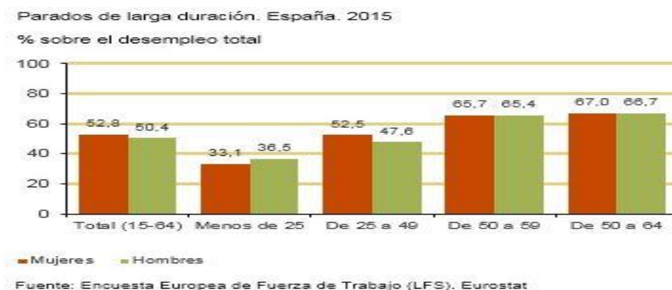
Gráfica 5: Gráfica de Parados de larga duración (mayor o igual a 12 meses) según grupos de edades.

Como se exponía al inicio de este trabajo, otro problema con los que cuenta la sociedad actual y que trata de abordar este proyecto, es el desempleo, especialmente en las personas que cuentan con edades de entre 35 y 55 años, siendo éstas las que más difícil tienen su acceso al mercado laboral. Según datos recogidos en el INE (2015), y tal y como se aprecia en la gráfica 5, es en el grupo de personas mayores de 50 años donde el porcentaje de personas paradas de larga duración es mayor, superando con creces al grupo de jóvenes.