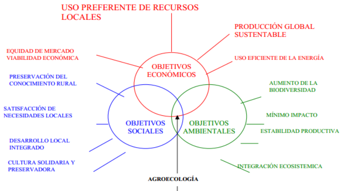
Fig 1. Objetivos de la Agroecología.

• Y de la misma manera por los mismos autores también se encuentran los Principios de la Agricultura Ecológica según la Federación Internacional de Movimientos de Agricultura Orgánica (IFOAM), donde se recoge claramente el porqué de este proyecto: