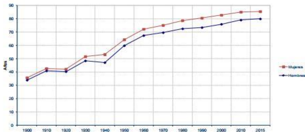
Gráfico 1. Esperanza de vida al nacer.

Fuente: Informe envejecimiento en red. Num.15 (pág.11)