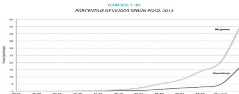
Gráfico 4: Porcentajes de viudos según edad 2013