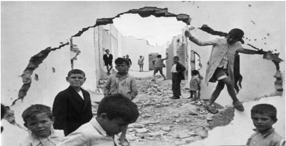
Unos niños jugando entre unas ruinas en Sevilla, en 1933.