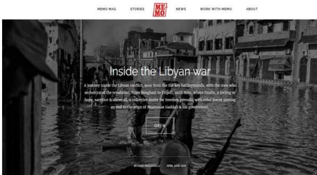
Portal de inicio de la revista citada en líneas anteriores.

Con todo lo mostrado, se puede apreciar cómo ha evolucionado el papel de la fotografía en este país, teniendo en cuenta las limitaciones que podían existir en ciertas ocasiones, así como el cambio de formatos y artilugios que hacen posibles la labor del fotoperiodista.