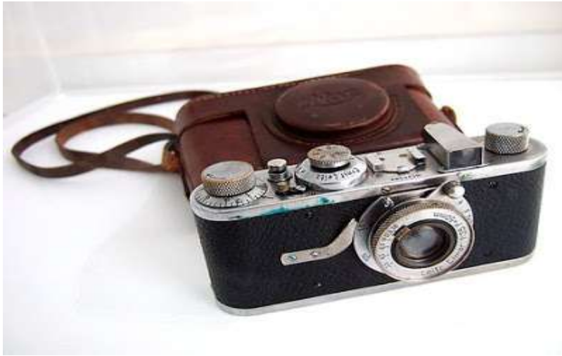
Ejemplo de cámara Leica

Quien realmente consiguió que la fotografía de prensa tuviera un mayor impacto fue el periodista gráfico Sam Shere. En sus trabajos destaca la espectacularidad de sus instantáneas, siendo buen ejemplo de ello las que captó en directo del accidente del dirigible Hidenburg, en el condado de New Jersey, el 6 de mayo de 1937.