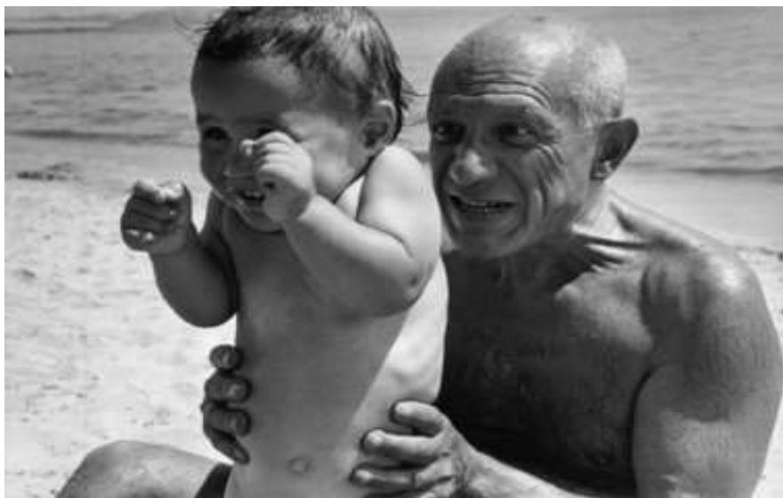
El retrato de Picasso. / El economista