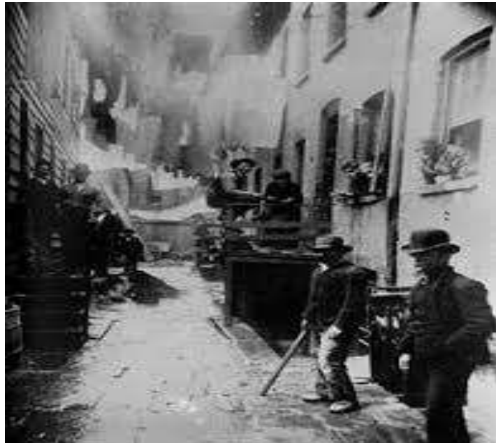
Uno de los barrios estadounidenses que inmortalizó.