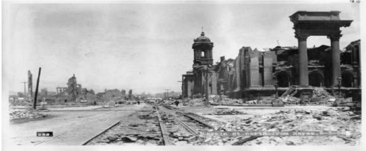
Estado en el que quedó San Francisco tras el sismo mencionado.

La fotografía de sucesos también tuvo sus comienzos a principios del siglo XX y vendría para convertirse en uno de los principales géneros fotográficos. En Norteamérica, fue Edwards Rogers quien fotografió el 18 de abril de 1906 la primera instantánea de esta temática durante un terremoto que sufrió la ciudad de San Francisco.