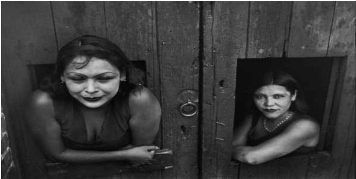
Calle Cuauhtemocztin, México. Año 1934.