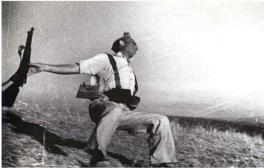
Muerte de un miliciano en la Guerra Civil española.

cubrir la Primera Guerra de Indochina en donde, como se ha comentado, moriría el 25 de mayo de 1954 tras pisar una mina de manera accidental. Estos son algunos ejemplos de sus obras más señaladas: