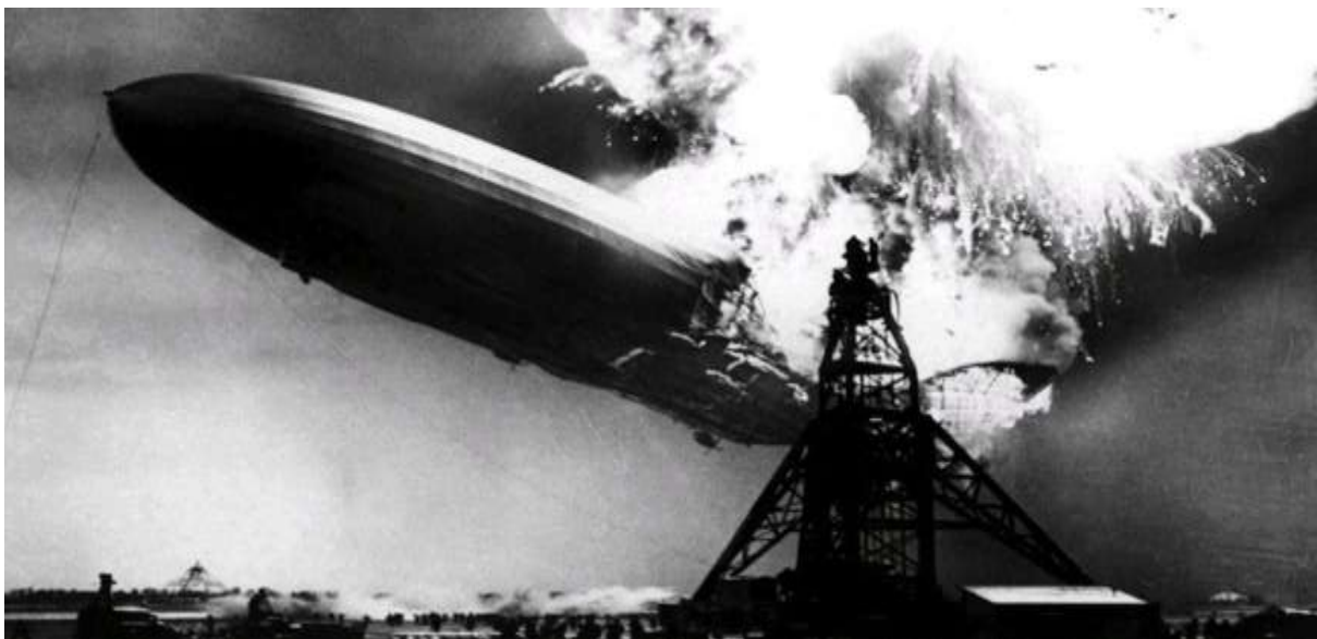
Dirigible 'Hidenburg' en el momento de la colisión.

Este se había chocado con unos cables de alta tensión que provocaron que se incendiara y cayera al suelo. Según comenta Alcoba en uno de sus libros, este hecho tuvo “un impacto similar al otorgado en España a las del fallido golpe de Estado del 23 de febrero de 1981”.