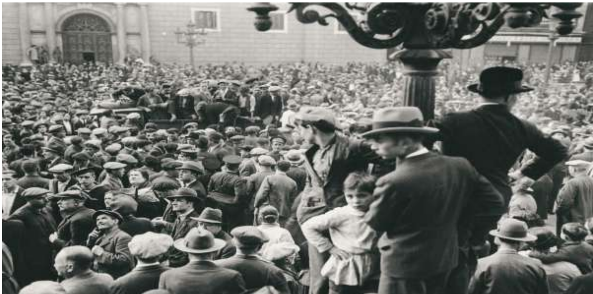
Plaza de Sant Jaume de Barcelona el día de la proclamación.

El periodismo gráfico también proporciona multitud de documentos que permiten observar momentos relevantes de la historia siendo el caso, por ejemplo, de la tomada el 14 de abril de 1931 en la plaza de Sant Jaume de Barcelona, día en el que se proclamó la Segunda República Española. Con este tipo de imágenes no solo se observa lo evidente, sino que también se pueden observar características propias de la época como la arquitectura, las vestimentas, las expresiones faciales de la población o la concentración de gente que pudo haber durante esos hechos y analizar la trascendencia que pudieron haber tenido.