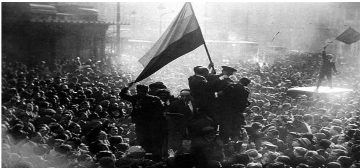
La famosa fotografía de la victoria de la Segunda República de Sánchez Portela.

En cuanto a los fotoperiodistas españoles más destacados de esa época en España cabe señalar la labor de Alfonso Sánchez Portela, quien inmortalizó una de las fotografías más icónicas de este periodo, la proclamación de la Segunda República en la Puerta del Sol de Madrid; o Agustín Centelles, quien retrató varias escenas de la Batalla de Aragón (1938) o la Guerra Civil (1936-1939), de la que se inmortalizó la sublevación de Barcelona, lugar en el que los republicanos vencieron frente a los sublevados. Muchos expertos han bautizado popularmente a este fotógrafo como el “Robert Capa español”.