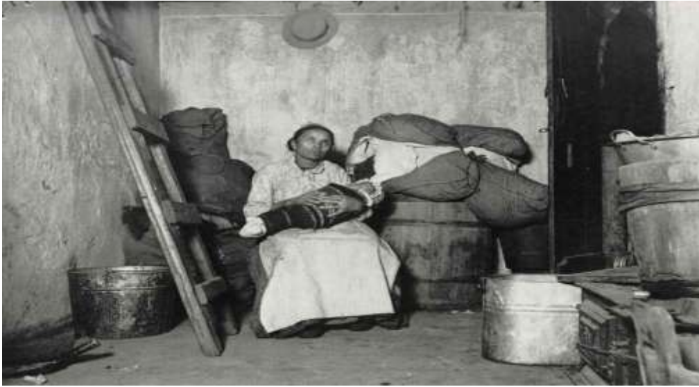
Una señora con su bebé en una casa humilde.