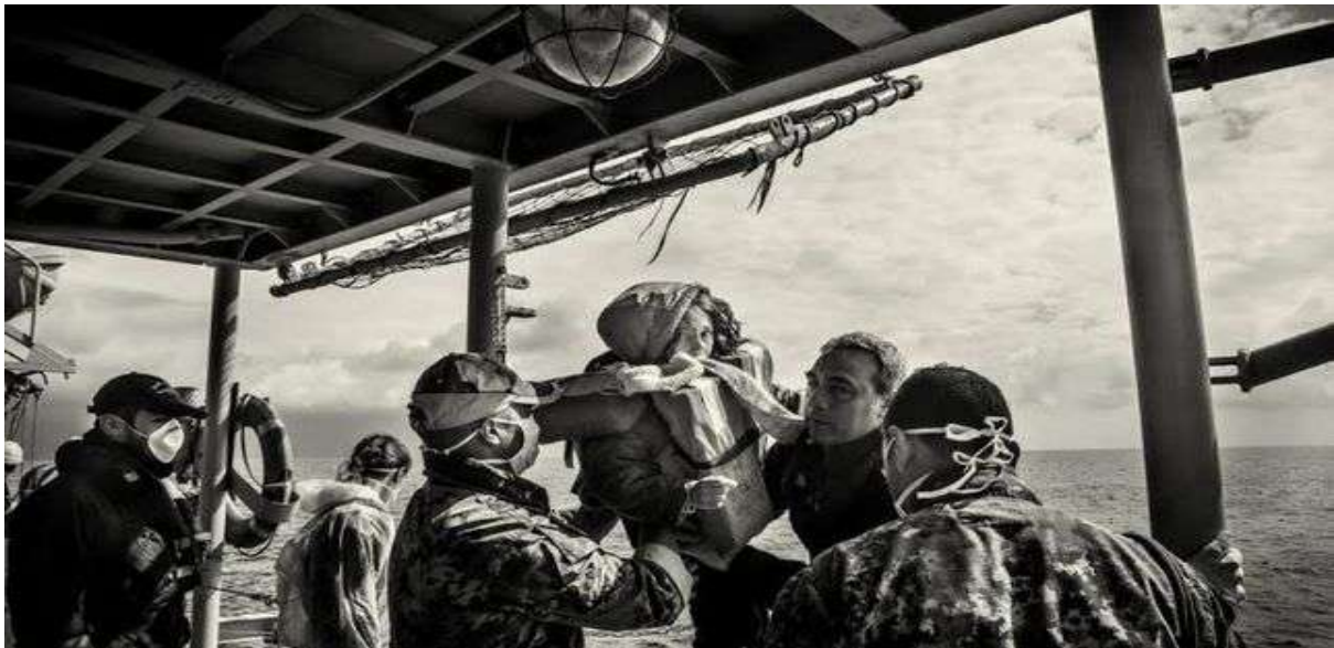
Una de las imágenes que ayudó a Spottorno a conseguir el World Press Photo en 2015.

Hoy en día, los periodistas fotográficos capturan sobre todo tipo de fenómenos relacionados con las lacras que afectan a la población, siendo el caso de la inmigración, los efectos de la crisis económica o el fortalecimiento de las desigualdades sociales. Un ejemplo de ello es el fotógrafo Carlos Spottorno, quien en el año 2015 ganó el World Press Photo 5 por su labor en el corto ‘A las puertas de Europa’, en donde se mostraba la situación de los inmigrantes que, a través de pateras y pequeñas embarcaciones, intentaban alcanzar las costas que les permitieran acceder a Europa.