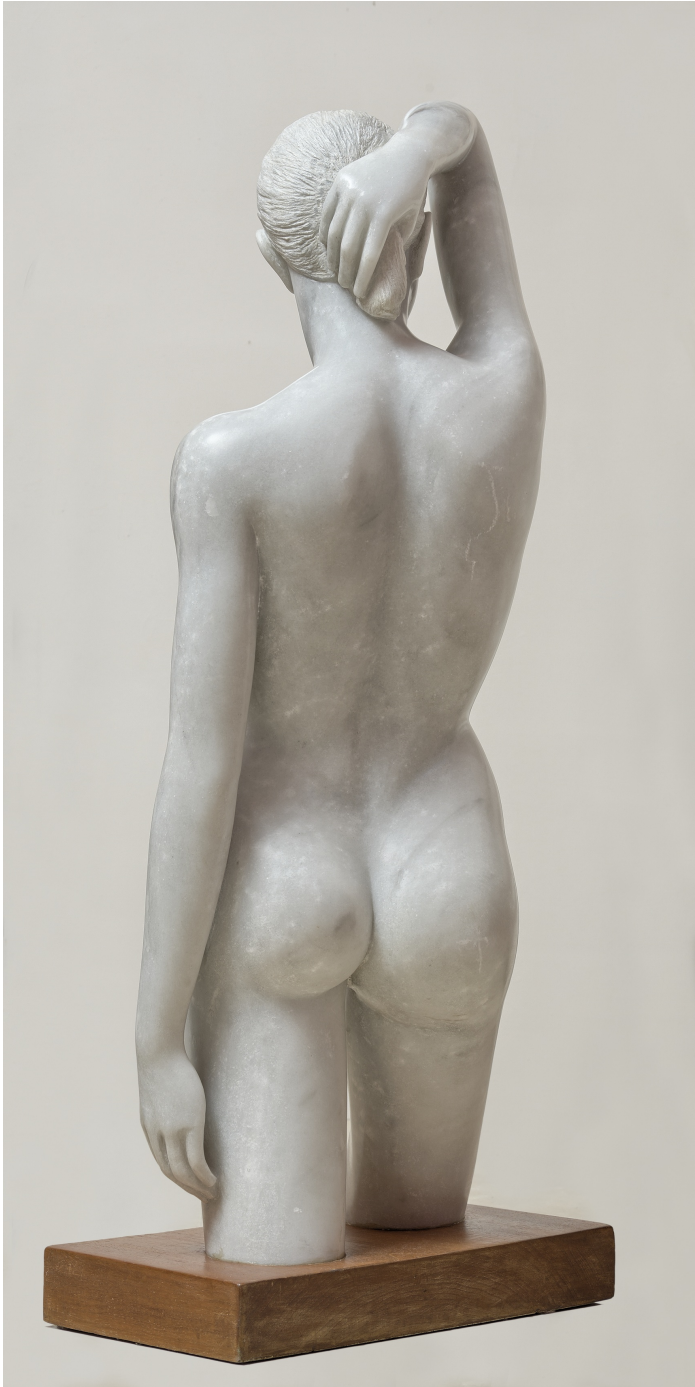
Mármol de Macael. 115X45X27 cm. 2007