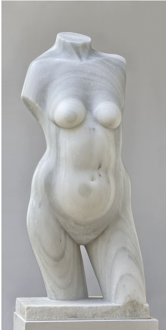
Mármol de Macael, 91X39X27 cm., 2010 (modelo de 1997)