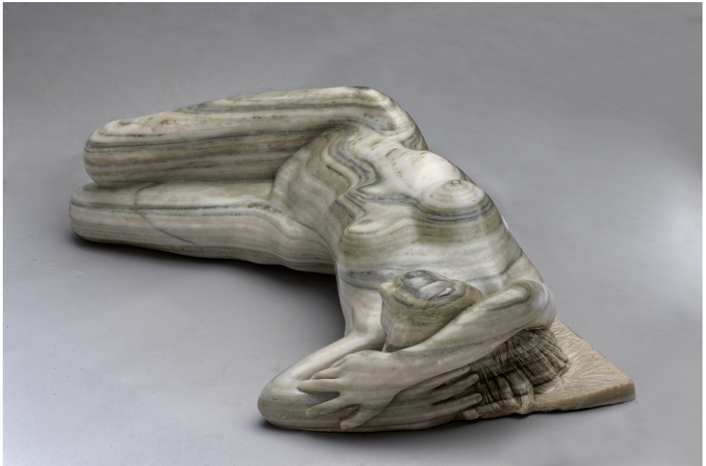
Mármol de Macael. 23x100x50 cm. 1998