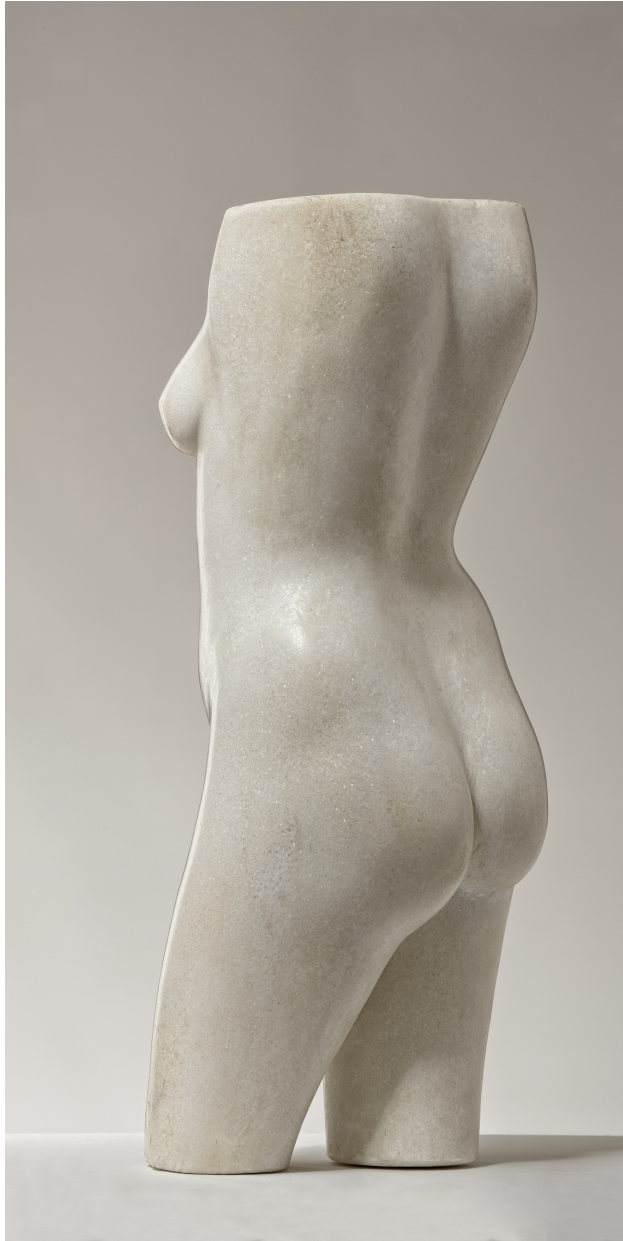
Mármol de Carrara. 44.5X18.5X16 cm. 2010