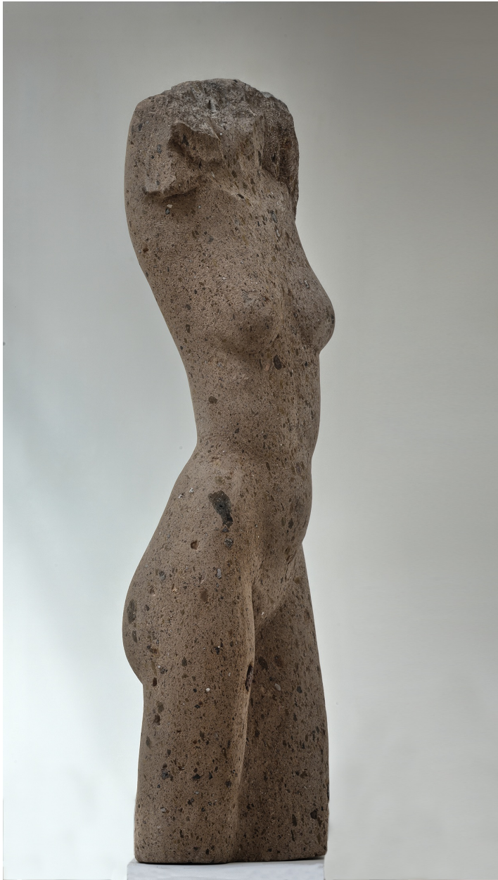
Piedra "chasnera" (Arico). 95x29x23 cm. 2010