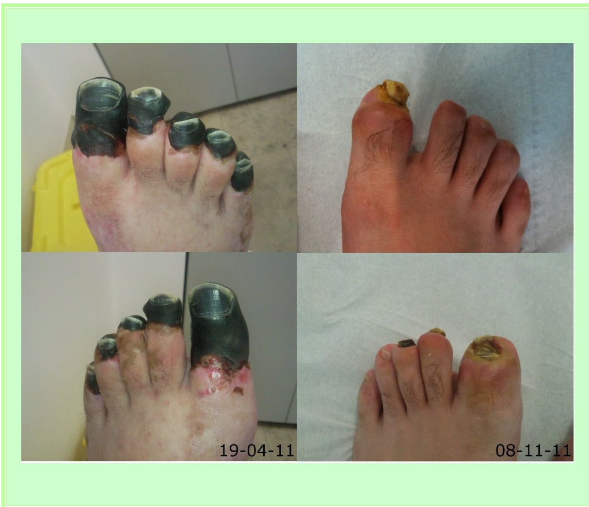
Imagen cedida por la sesión de Medicina Hiperbárica (curación completa de la herida)