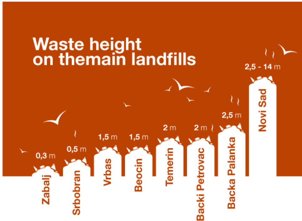
Figura 2. Altura comparada de los vertederos en Serbia