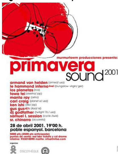
Figura 1. Cartel del primer Primavera Sound

En contraposición al espíritu político del festival serbio tenemos el Primavera Sound. Este se define a sí mismo como un evento que combina una mezcla de estilos musicales en un ambiente de asistencia masiva, pero conservando al mismo tiempo la seguridad y, en algunos casos, hasta la intimidad de las actuaciones. Con esta premisa nació en 2001 en el Poble Espanyol, Barcelona, con un solo escenario, una veintena de artistas nacionales e internacionales y el apoyo de tres patrocinadores.