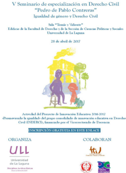
Figura 5. Quinto Seminario Promoviendo la Igualdad.