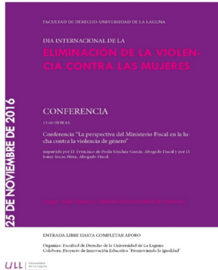
Figura 6. Colaboración con el Día de eliminación de la violencia contra la mujer (25 de noviembre)