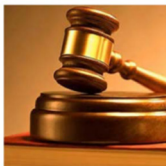
Figura 8. Boletín CIADGE del Cabildo de Tenerife, N.º 45, mayo 2017, pág. 13. Disponible en: https://goo.gl/zMq2du .

Durante estos meses, en esta formación se han abordado temas como la sensibilización, la identificación del maltrato, las situaciones de desigualdad, recursos asistenciales para la atención a las víctimas de violencia de género, dedicadas también al colectivo LGTB. Para ello se han realizado actividades en las clases o seminarios propios, con presentaciones audiovisuales y debates, en los que también participan agentes de igualdad e representantes de colectivos a propósito de los derechos relacionados.